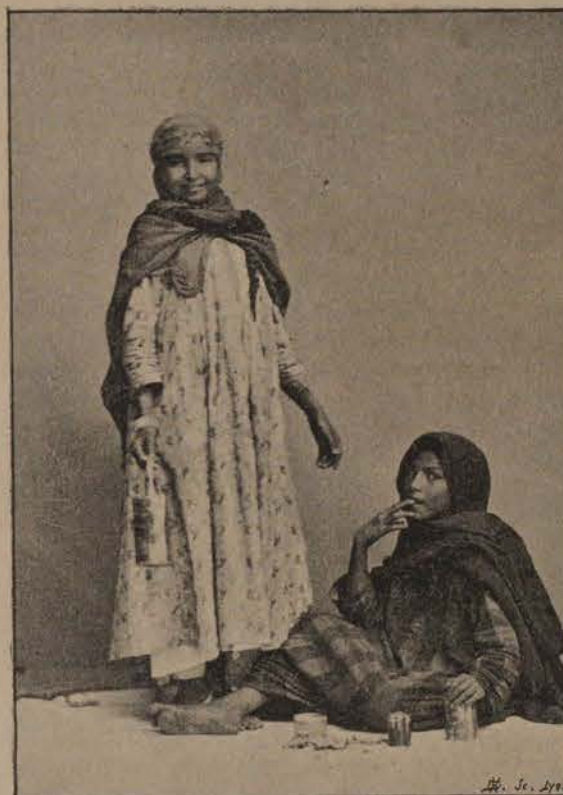
Les Ramasseuses de Cigarettes.

Chacun sait qu'il en faut pour faire des folies.