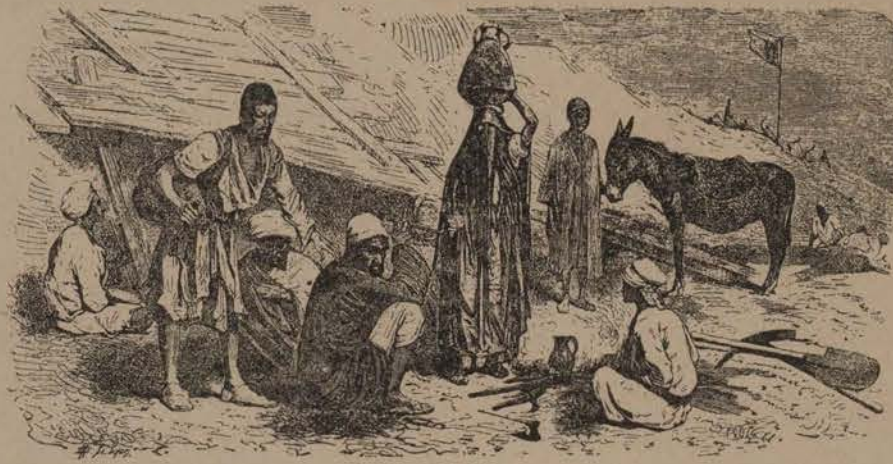
Campement de Fellahs travaillant à la construction d'un Canal

Fort soupçonné de tentative De vol ou de corruption Un emuque voit qu'on le prive De sa modeste fonction. Alors l'homme sans appendice S'exclame ainsi naïvement : « Remboursez moi, car c'est justice, Au moins mon cautionnement. »