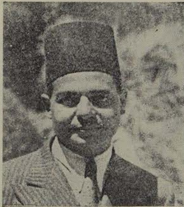
S.E. SABA BEY HABACHI

— Comme vous le savez déjà, nous répond le ministre, un Comité a été constitué auprès du Ministère de la Justice avec pour mission la révision du Code du Commerce. La procédure des faillites rentre dans cette révi-