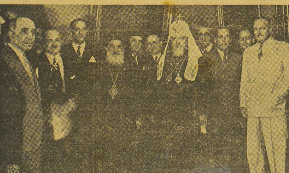
S.B. Mgr. Alexis, patriarche de Moscou, a reçu hier soir le corps consulaire. On remarque à ses côtés les consuls généraux de Grande-Bretagne et des États-Unis ainsi que d'autres personnalités. — (Voir en page 4, d'autres détails sur la visite de Sa Béatitude).