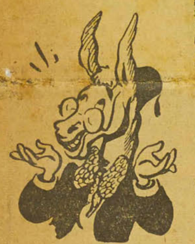
(Des difficultés ont porté obstacle à la mise en application de la loi sur l'alphabetisme)