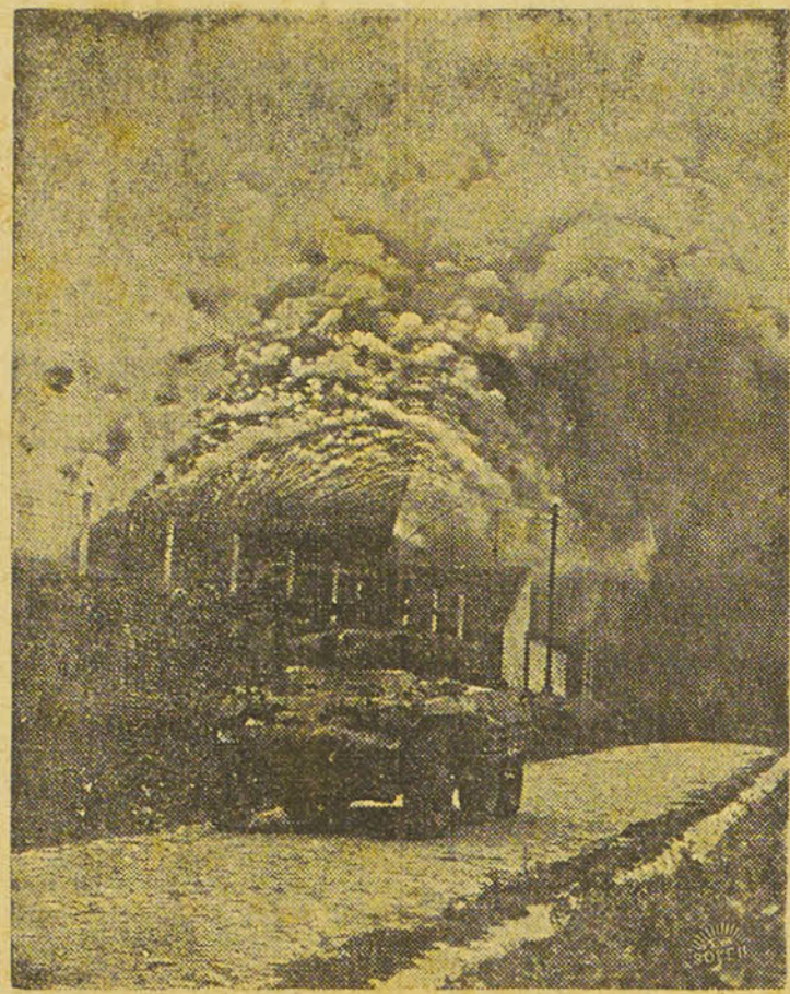
Vision apocalyptique. — Dans une ville sur la ligne du front allié, un tank américain longe le mur d'une ferme dont la grange a été incendiée au cours des combats.

DEPUIS quelque temps, il est un slogan qui revient beaucoup dans les discussions politiques, celui qui proclame que « l'intérêt individuel doit céder à celui de la collectivité ».