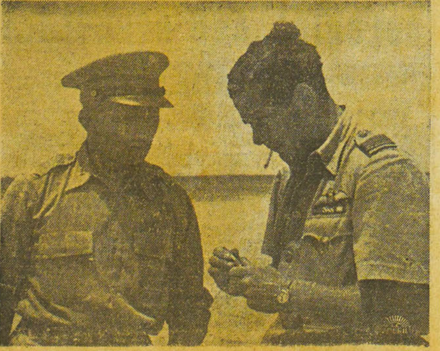
Un officier supérieur de l'armée de l'air américaine s'entretient avec un collègue britannique sur les opérations aériennes effectuées au désert.

Le communiqué. Quartier Général Allié, Pacifique sud-ouest, 20. — Le communiqué d'aujourd'hui déclare : FAISI, Salomon : Nos bombardiers lourds attaquèrent des navires de guerre ennemis avec des résultats inconnus. Un violent feu anti-aérien fut rencontré. Tous nos avions retournèrent à leur base.