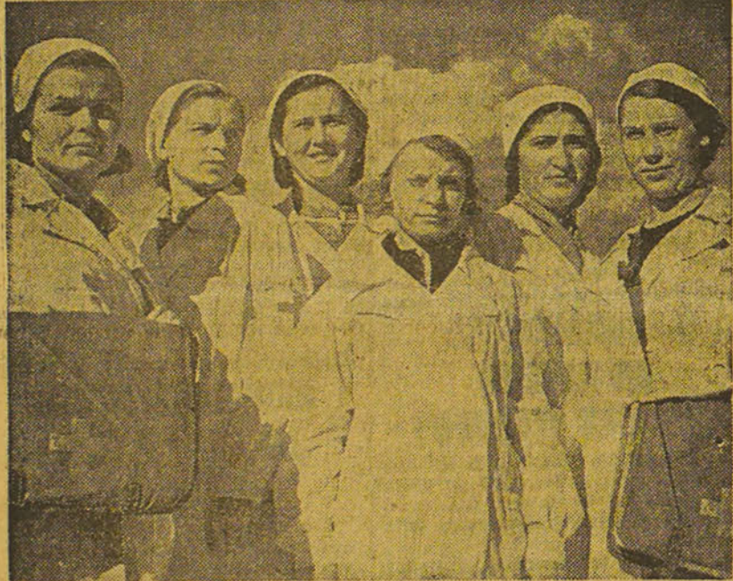
Les femmes soviétiques prennent un rôle direct et très actif dans la guerre. Voici un groupe d'étudiantes de Soukhoumi qui se sont engagées comme infirmières pour le champ de bataille.

Si nous pouvons continuer à renforcer les lignes soviétiques avec des tanks, des avions et du matériel de guerre, en quantités appropriées aux besoins des combattants, cela permettra à l'U.R.S.S. de poursuivre un effort grâce auquel la formidable machine de guerre nazie sera brisée à l'automne — époque où le dernier soldat allemand à se trouver encore en Russie sera mort ou prisonnier.