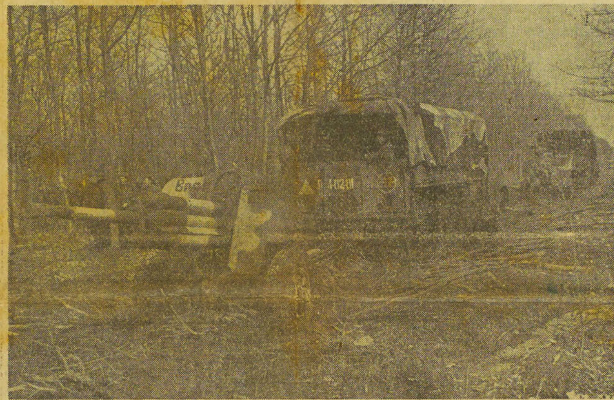
Sur le front Sud-Ouest. Des tracteurs américains pour l'armée rouge.

MOSCOU, le 22 (R) — La radio de Moscou a annoncé ce matin, (lundi) :