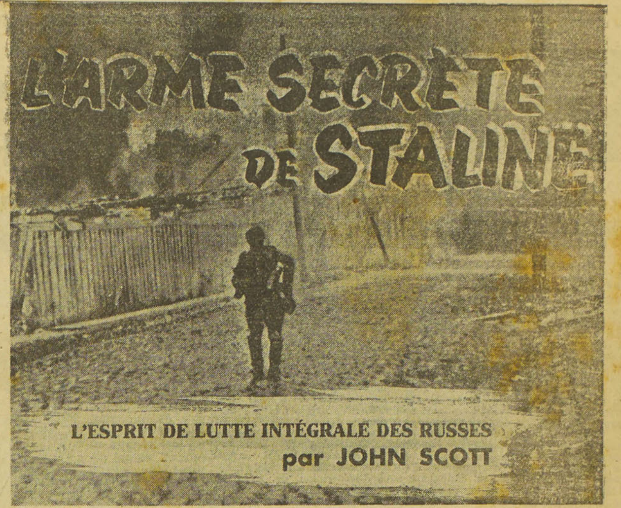
L'ESPRIT DE LUTTE INTÉGRALE DES RUSSES par JOHN SCOTT

Les Allemands ont subi de lourdes pertes autour de Sébastopol. La 7 e division d'infanterie allemande et la 11 e division roumaine ont été anéantis.