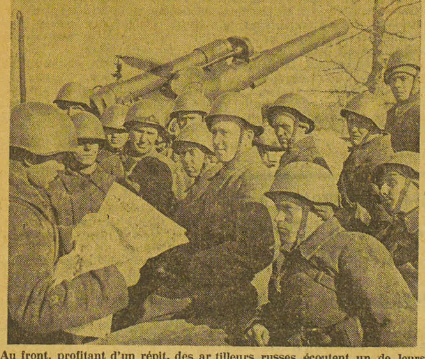
Au front, profitant d'un répit, des artilleurs russes écoutent un de leurs camarades qui lit un journal donnant les dernières nouvelles de la lutte.

Un immigrant juif qui vient d'arriver de Russie en Palestine raconte qu'au cours de ses pérégrinations dans l'immensité russe en tant que réfugié de Pologne il a pu constater que la vie juive n'a pas cessé dans les masses juives de Russie. La publication de livres en hébreu était interdite, c'est par les livres religieux autorisés par le gouvernement que la jeunesse juive apprend l'hébreu. L'immigrant en question a lui-même appris de cette façon la langue hébraïque dans un cercle sioniste en Sibirie.