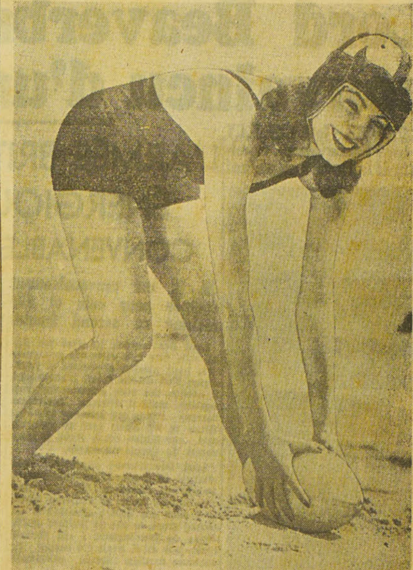
L'annonce du mariage de Mickey Rooney fut une surprise générale. Le célèbre Andy Hardy a épousé une inconnue Ava Gardner.