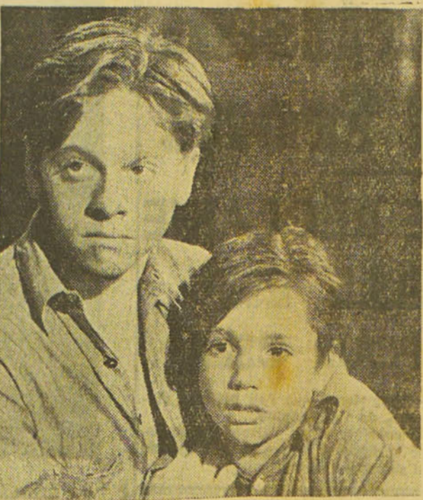
Darryl Hickman avec Mickey Rooney dans « Men of Boys town »

Devant les succès remportés par Mickey Rooney, Shirley Temple, Judy Garland ou Deanne Durbin, Hollywood s'empresse de former de nouvelles équipes de jeunes.