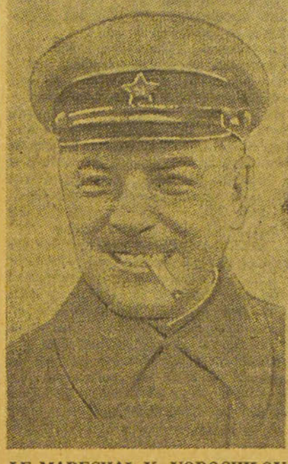
LE MARECHAL K. VOROCHELOV organisateur de la résistance et — bientôt — de la victoire russe

Cette fois, les Allemands doivent assurer la police d'un territoire bien plus considérable, avec une population beaucoup plus homogène et organisée. Par dessus tout, une Russie libre poursuit magnifiquement la guerre, organisant et équipant des bandes de guérilla, tandis que le sa-