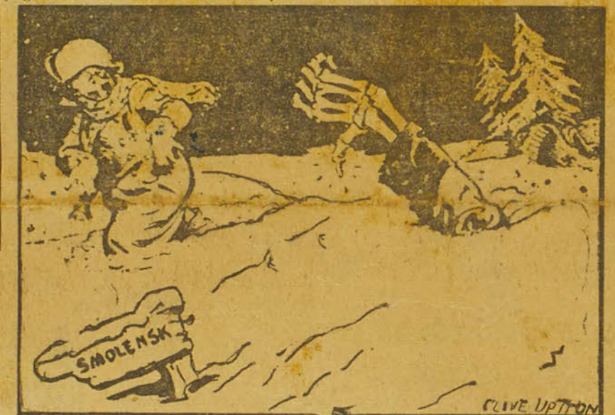
HITLER. — On n'en finit pas avec ces neiges ! L'hiver elles arrêtent les tanks ; au printemps, on ne peut même pas marcher à pied.

tante soit à signaler. Dans le secteur de la rivière Svir, entre les lacs Ladoga et Onega, les informations publiées à Stockholm suggèrent encore plus clairement qu'une sérieuse pénétration russe a eu lieu dans les positions finlandaises.