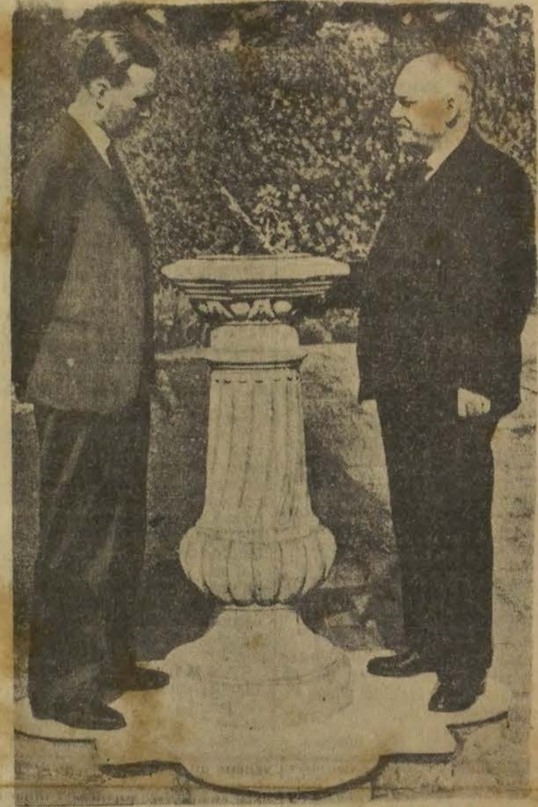
Dans le jardin de l'ambassade des Soviets, à Londres, M. Maïsky s'entretient avec un visiteur.

Il passe au moins deux heures par jour à les soigner, à donner des conseils à ses jardiniers. Quand il fait beau, c'est d'ailleurs dans son jardin, autour d'un jet d'eau, qu'il reçoit ses visiteurs et accorde ses interviews.