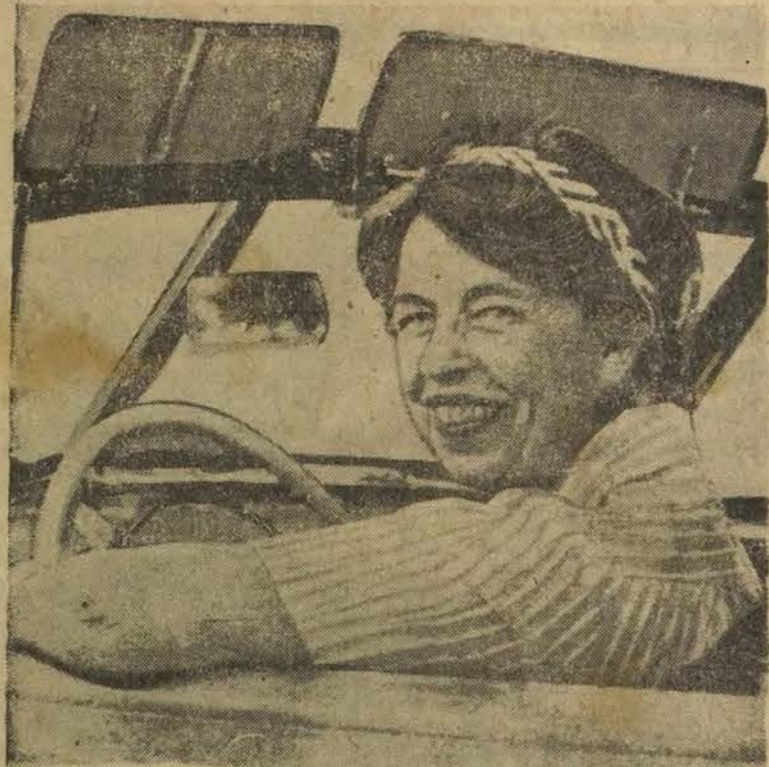
Mme Franklin Roosevelt au volant de son automobile.

«Les femmes peuvent tout faire» dit Mme ROOSEVELT