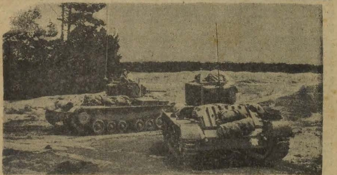
Le «Valentine», le dernier-né des tanks anglais, est un tank de seize tonnes.

Lorsqu'Hitler prit le pouvoir, les techniciens de la Reichswehr lui communiquèrent leur confiance en cette arme encore neuve. Les Allemands fabriquèrent une véritable nuée de tanks légers et quelques tanks lourds. La campagne de Pologne (la guerre d'Espagne avait déjà fourni une indication) démontra la vulnérabilité des tanks légers.