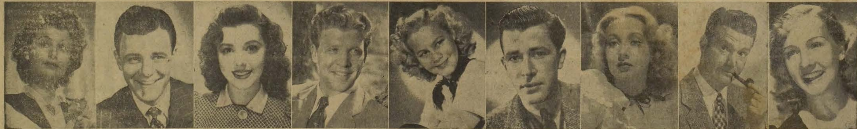
Ruth HUSSEY Robert STERLING Ann RUTHERFORD Dan DAILEY Jr. June PREISSER John SHELTON Ann SOTHERN Red SKELTON Bonita GRANVILLE