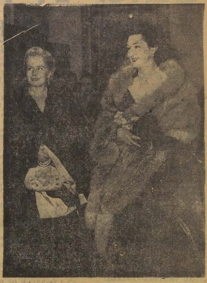
Hier a eu lieu au théâtre Mohamed Aly la soirée de bienfaisance italo-égyptienne avec les concours des artistes de la troupe lyrique. Cette soirée était placée sous la présidence d'honneur de S.A. la princesse Nazi Ghah qui l'on voit ici en compagnie de Mme Soehel. (Lire en page 2).