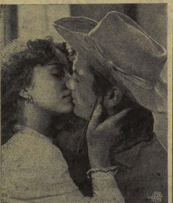
Tandis que Jennifer Jones incarne le rôle de l'héroïne, c'est à Gregory Peck qu'il est revenu d'interpréter le rôle de Lewt, la vedette masculine de «Duel in the Sun», qui sera projeté au Cinéma Fétial à partir du lundi 2 janvier 1950.

Après la première projection de «Duel in the Sun», le public s'est aperçu que Gregory Peck était en mesure d'incarner, en même temps que les prêtres méditatifs et les intellectuels timides, les mauvais garçons farouches et «tomberos» de filles. Aussi fut-il acclamé «premier mauvais garçon d'Amérique».