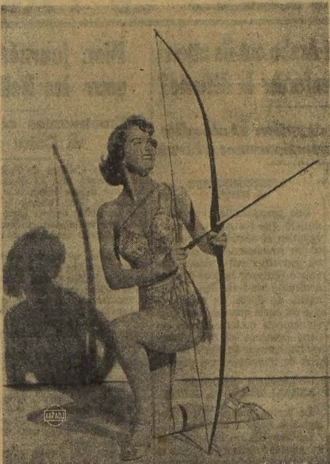
Le tir à l'arc est fort à la mode aux Etats-Unis. Dans les universités américaines, on enseigne aux belles étudiantes le maniement de l'arc et des flèches. Mais qui les protégera de celles — bien plus dangereuses — de Cupidon?