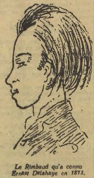
Le Rimbaldite qu'a connu Rimbaldite en 1871.

Décidément, Rimbaldite devient comme la mode des chapeaux de pèlerins... Le Rimbaldite qu'a connu Rimbaldite en 1871.