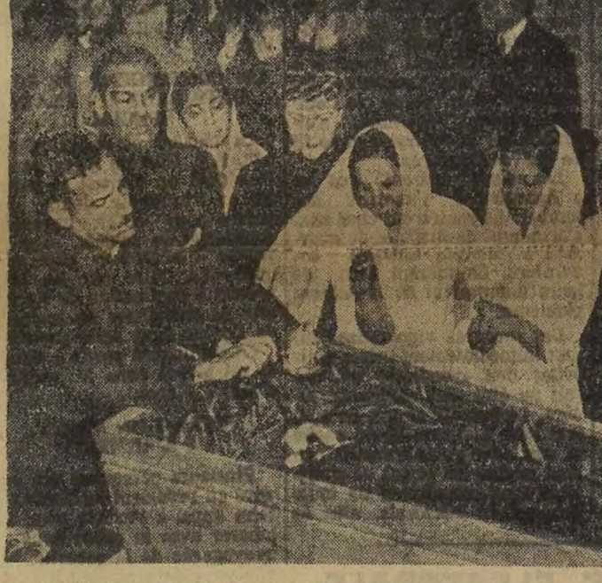
Les funérailles se sont déroulées selon le rite hindou et ont pris fin avec la crémation de la dépouille mortelle au cimetière de Verano. Les cendres seront ensuite expédiées aux Indes.