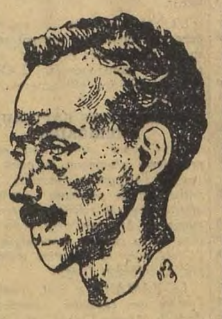
Le Sage et le Saint mis au point par Patrice Barthelet, d'après un dessin d'Isabelle Rimbaldite.