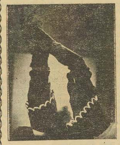
Longs gants en suède de velours noir à larges revers garnis de festons en glacé.