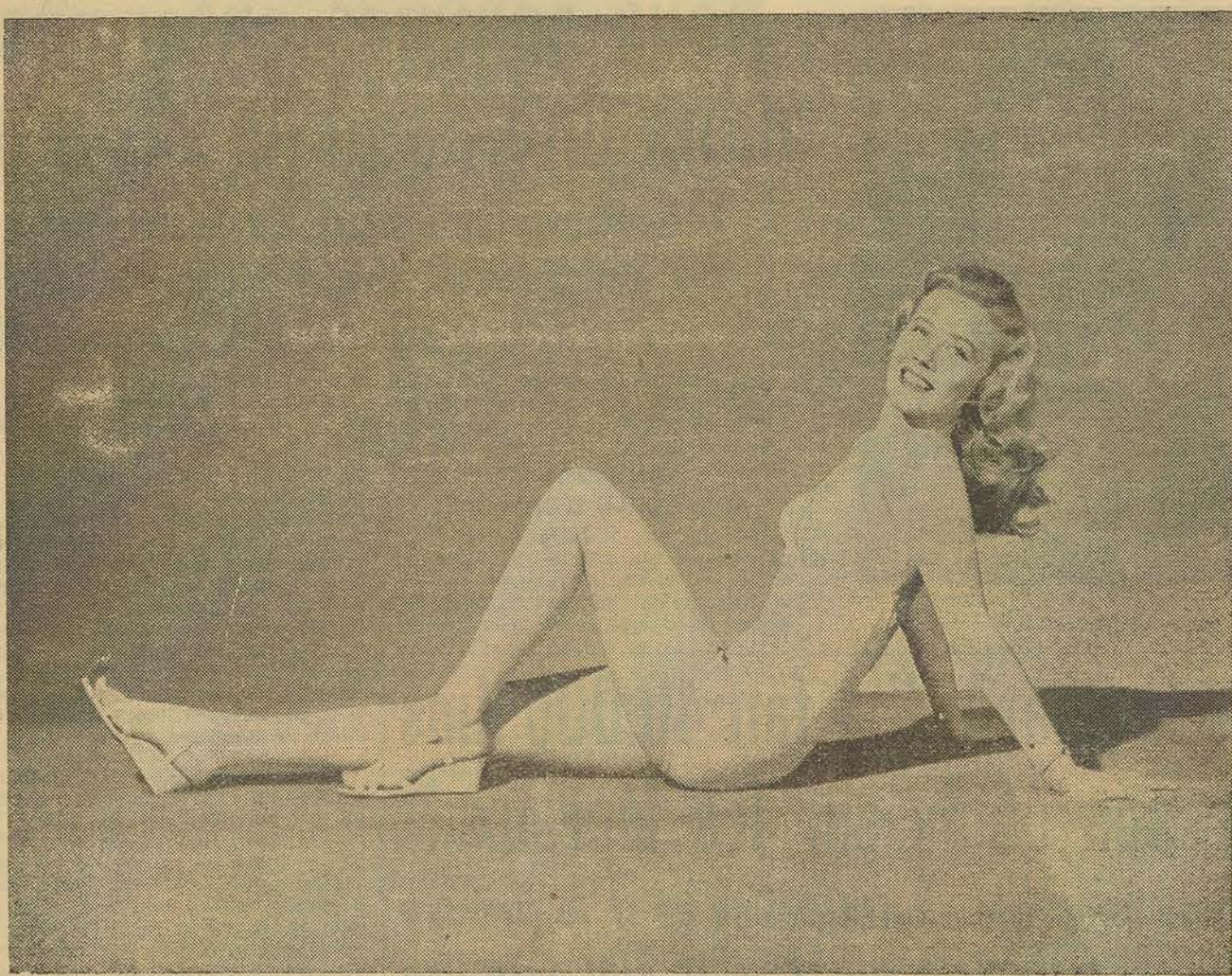
Joyce Holden, blonde naturelle de 1 m. 68, ex-mannequin originaire de Kansas City, actuellement surnommée «la comédienne la plus merveilleuse après Betty Hutton», se prélassait au soleil. Les bains de soleil n'ont pas détruit son charme.