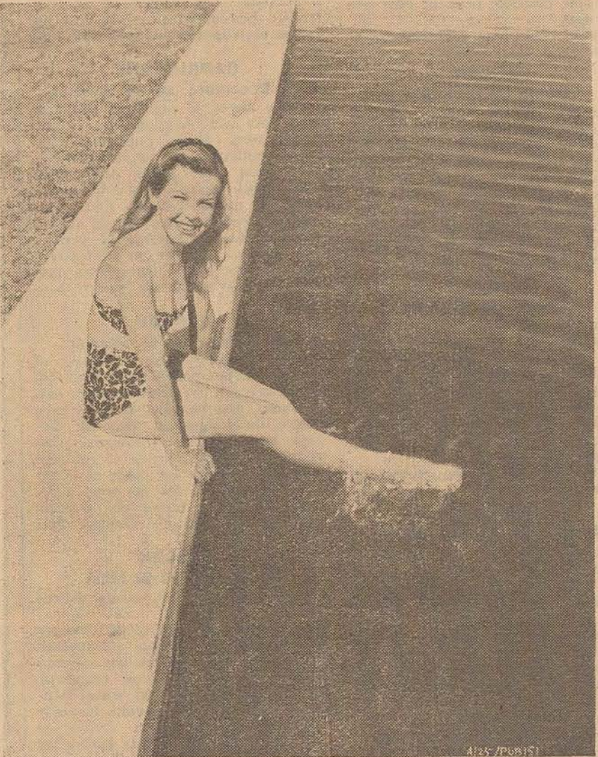
Cécile Aubry trempe ses pieds dans l'eau de la piscine, incédée. N'est-elle pas trop fraîche...

que née, au fond. Toute petite j'ai appris à "godiller", et je vivais naïvement, avec de longues nattes, jouant au vieux soldat ou au corsaire.