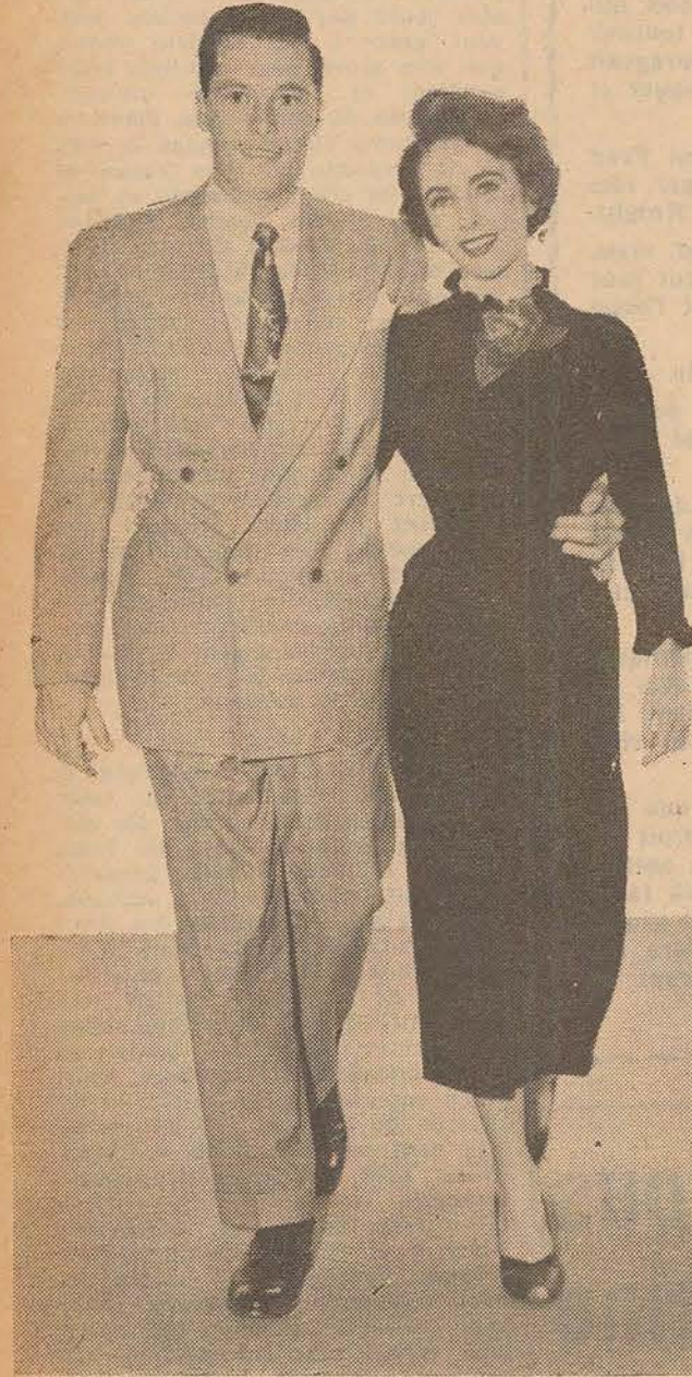
Elizabeth Taylor vient de se marier avec ce grand beau garçon: Conrad Nicholson Hilton Jr. Il est le propriétaire d'une chaîne d'hôtels à travers la Californie...