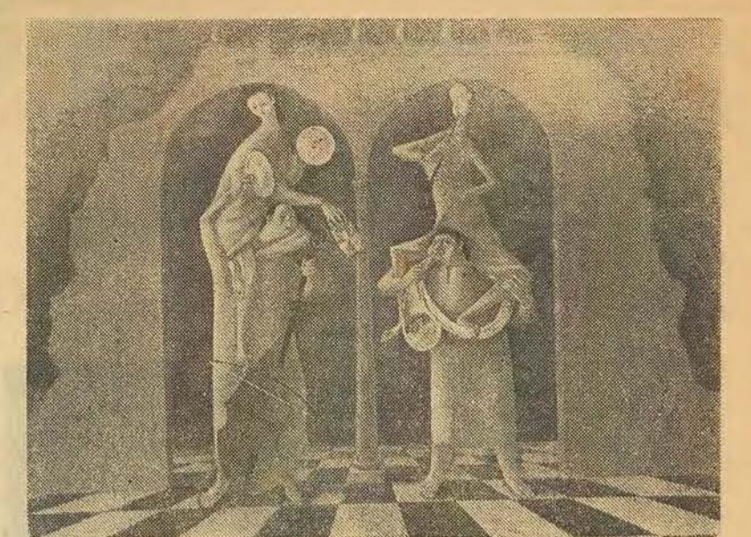
« Musiciens »