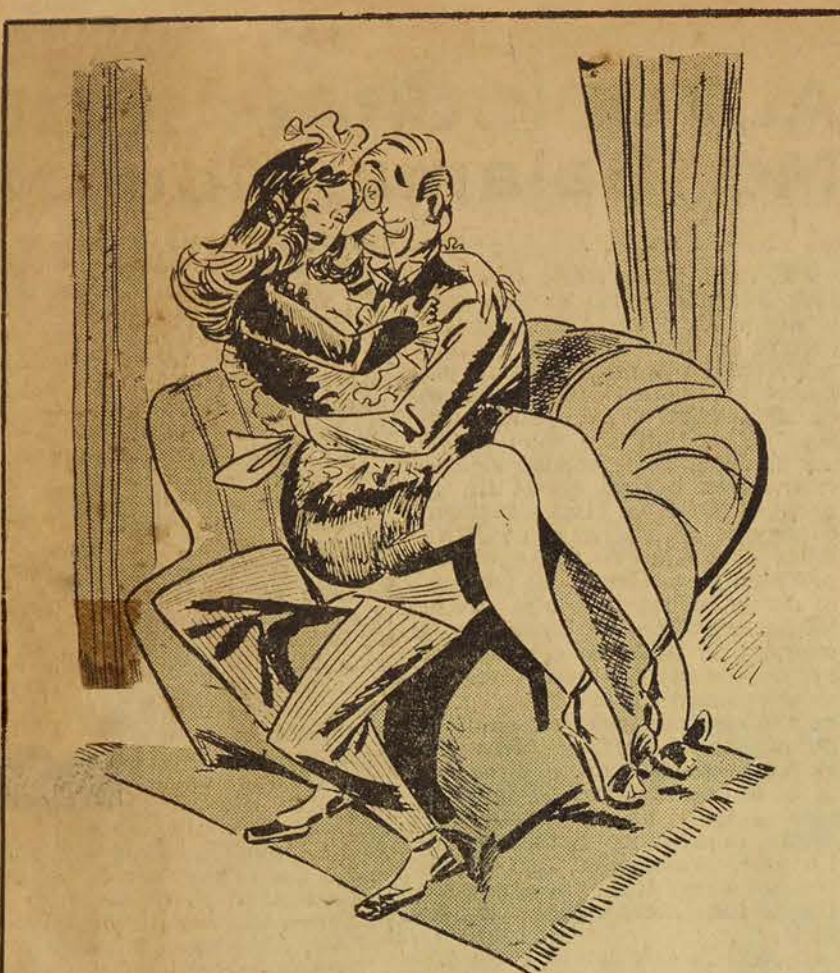
La femme de chambre : Monsieur tardera à venir. Voulez-vous l'attendre ? Le visiteur : Mais... je préfère qu'il ne vienne pas du tout !