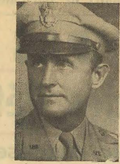
Le Général Gruenther

Comment fonctionne l'OTAN? Le fonctionnement de l'OTAN est remarquablement simple, pour un organisme aussi vaste.