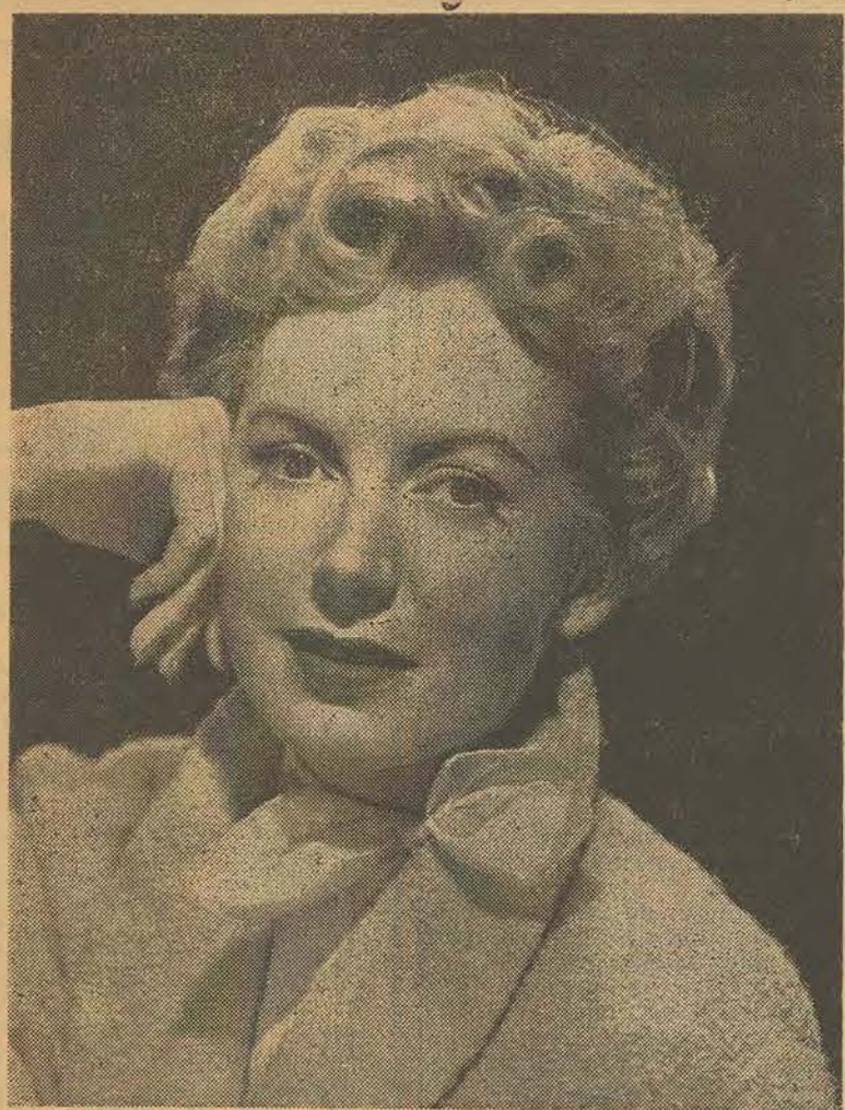
DEBORAH KERR, l'excellente vedette de la M.G.M. que nous avons vu dans plusieurs films.