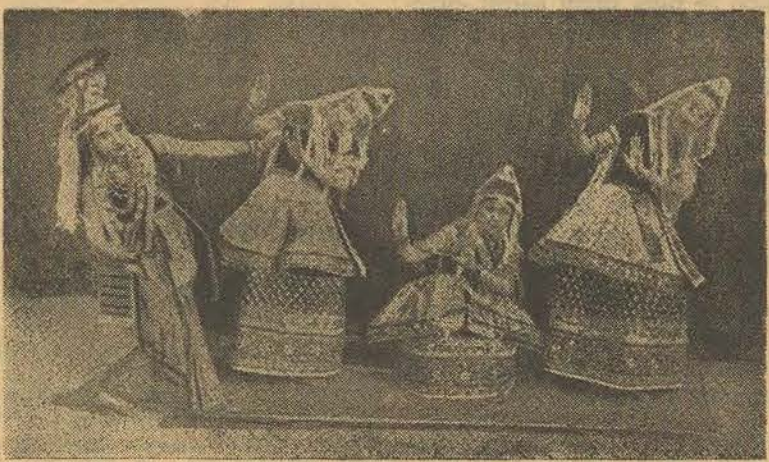
Danse du Seigneur Krishna — Dieu de l'Amour.

Sur les frontières d'Assam, au nord-ouest de l'Inde, existe le merveilleux Etat de Manipour, avec ses maisonnettes et champs de blé. Ses habitants sont simples et artistes. Leur occupation principale est le tissage ; dans cette occupation, la femme a une place importante. Nous la voyons tisser et broder durant une grande partie de la journée ; elle ne le fait pas nécessairement pour un gain-pain, mais par coutume ancestrale. Les riches sujets qui bordent les « sarongs », les « saris » et les châles sont l'œuvre des mains féminines, et constituent des rares pièces d'art.