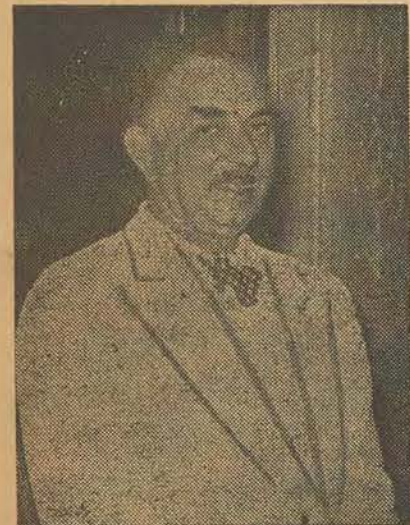
NOURI EL SAID

La plus longue crise gouvernementale de l'Iraq s'est terminée avec la constitution d'un nouveau gouvernement ayant à sa tête Mohamed Fadel al-Djamali, ancien président de la Chambre. Le nouveau premier ministre n'est pas inconnu dans la politique irakienne et dans le monde arabe. Il a été à plusieurs reprises ministre des Affaires étrangères et président du Conseil ; il a représenté son pays aux sessions de l'O.N.U. et aux conférences inter-arabes.