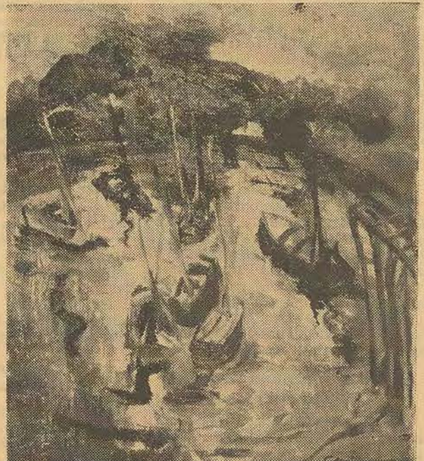
Le Port de Dieppe (T. Halim)

Stôt rentrée au Caire, Tahia Halim reprend ses sujets de la foule