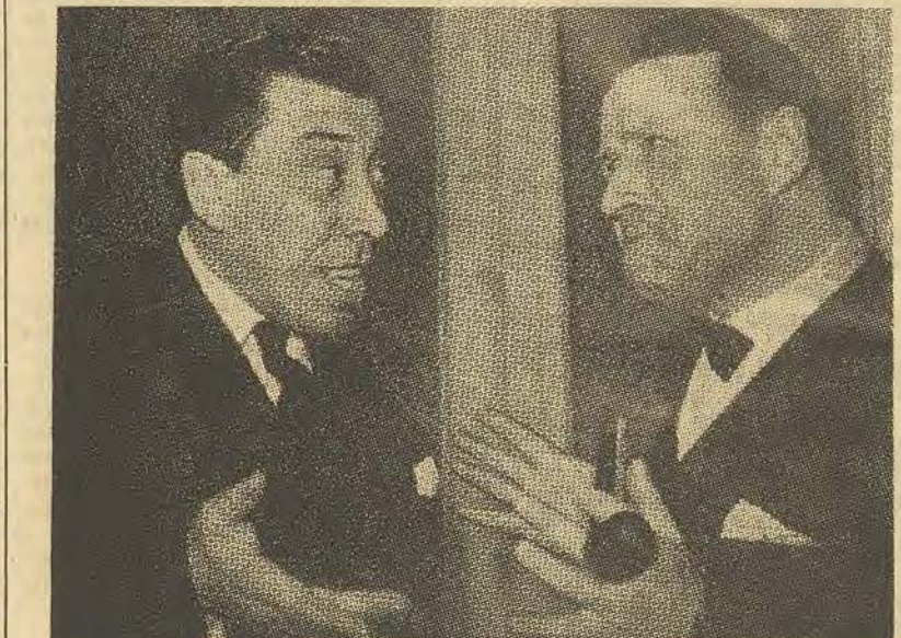
Georges Simonon mimant une scène avec Fernandel.