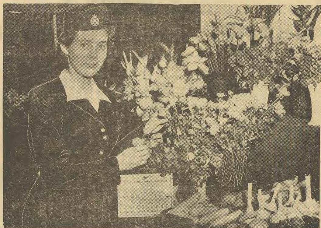
Grâce aux activités du Ministère de l'Agriculture du Caïre, tous les gros importateurs et visiteurs du Royaume-Uni de Grande-Bretagne ont pu admirer la vaste gamme des produits égyptiens qui furent exposés la semaine passée à l'Exposition des Fleurs qui s'est tenu à Londres. Ils ont pu admirer à part les fleurs et céréales, tout un choix de fruits que nous trouvons en ce moment sur nos marchés. Pour coopérer à l'introduction de ces denrées sur les marchés mondiaux, la B.O.A.C. a bien voulu prendre à sa charge leur transport à Londres.

Ce congrès examinera les conséquences du traité de réparations