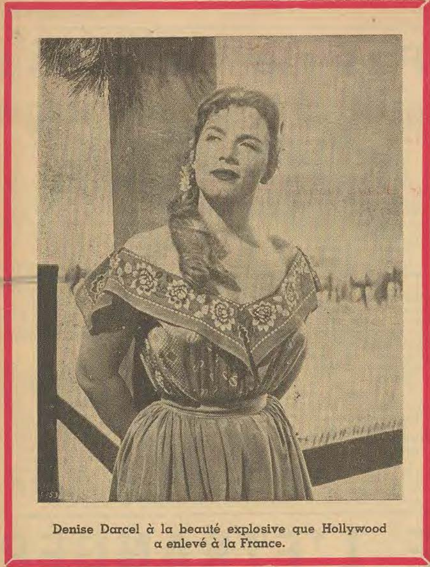
Denise Darcel à la beauté explosive que Hollywood a enlevé à la France.