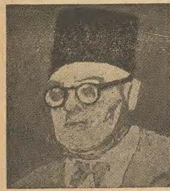
Me. FIKRI ABAZA

Depuis les jours lointains où, tout jeune journaliste, Fikri Abaza écrivait des lettres savoureuses d'une anglophobie outrancière et qui faisaient la joie de Kitchener, le grand polémiste est resté fidèle à lui-même. Témoignage assez rare qu'on puisse rendre à un politicien et que je lui adresse avec toute mon affectueuse sympathie.