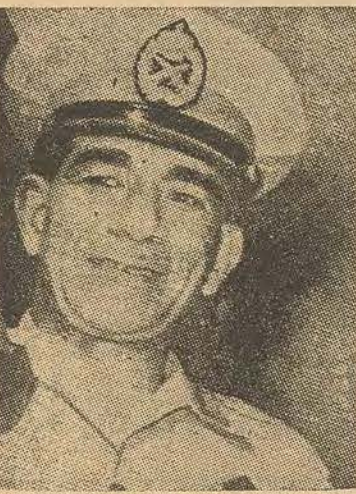
Le gén. Moh. NAGUIB

La communauté égyptienne qui peut souffrir le plus de ces calomnies perfides est, certainement, la communauté israélite. Cependant, toute l'histoire de l'Egypte contemporaine, depuis Moustapha Kamel et Saad Zaghloul témoigne de sa loyauté, de son patriotisme et de son esprit de sacrifice.