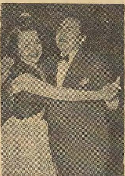
Le soir de l'inauguration du Festival de Cannes, Olivia de Havilland danse avec E.G. Robinson.