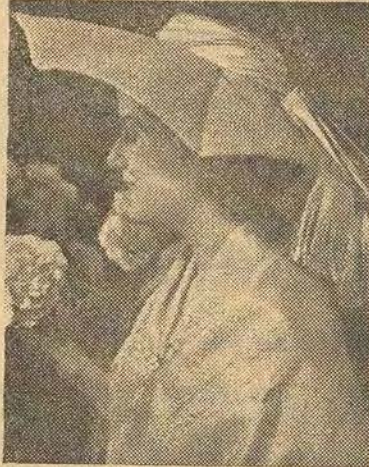
Ravissante capeline en poil de rose, de Maud et Nano, garnie d'un ruban drapé en twill.