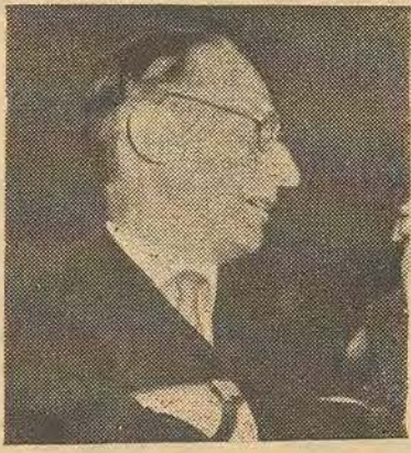
M. ALCIDE DE GASPERI

L'une, victorieuse, qui a laissé un esprit de conquête et un désir d'expansion, l'autre, qui s'est terminée par la défaite et qui a laissé un sentiment de dépression qui a por-