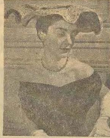
L'ombrelle de nos aïeules a inspiré G. Orsel pour cette capeline de tulle noir et chantilly.