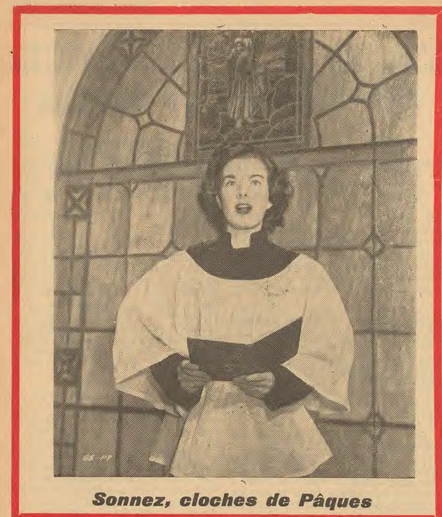
Sonnez, cloches de Pâques