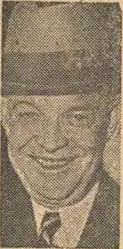
Dwight D. Eisenhower

Les électeurs américains qui choisirent le Général Dwight Eisenhower par une majorité écrasante n'ont pas élu simplement un président des Etats-Unis, mais en fait, aussi un président de la moitié du monde encore libre. Il est clair que dans cette tâche il aura un travail encore plus difficile que celui de surmonter les difficultés intérieures.