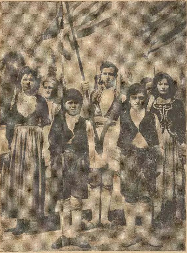
La jeunesse hellénique, en costumes nationaux, fêtant l'indépendance de la Patrie.