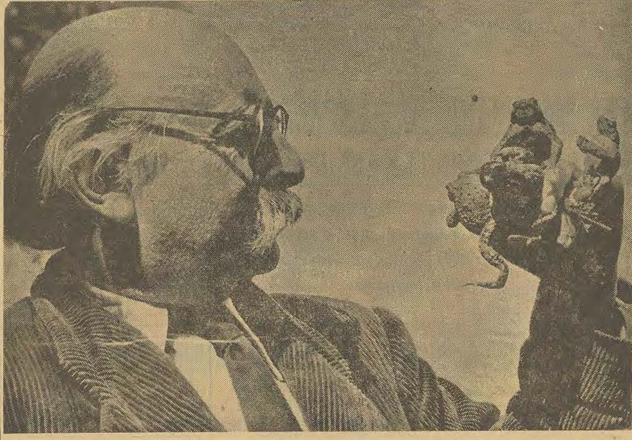
LES BIOLOGISTES FERONT-ILS DES ENFANTS SANS PERE ? (Voir article en page 2) Dans sa propriété de Ville d'Avray, près de Paris, le célèbre biologiste Jean Rostand fait naître des grenouilles sans père. Le savant se plaît à éliminer le mâle du processus de la procréation.

N.B. — A propos de compréhension, le lecteur vient de lire un entrefilet ci-dessus du journal « Le Monde ». Nous voudrions que nos confrères arabes conservent une pareille aménité. Ils serviraient mieux les causes qu'ils veulent défendre.