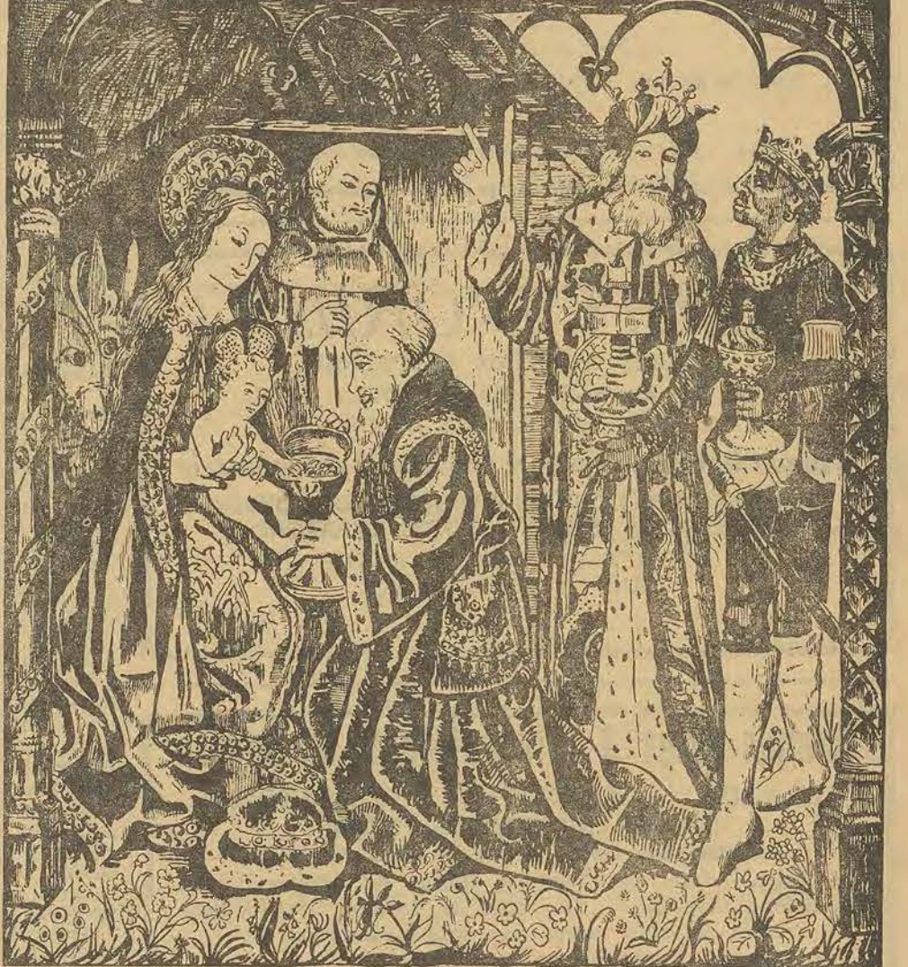
Les Rois Mages nous apporteront-ils ; comme cadeaux, l'Or, l'Encens et la Myrrhe de la Paix, de l'Abondance et de la Sécurité ?