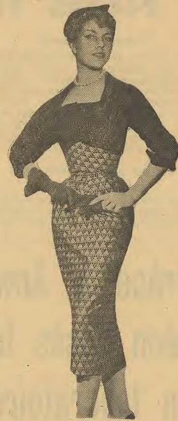
Robe de cocktail en gaze d'opion rouge façonnée noir. Petit boléro et chapeau de velours noir. Mod. Jean PATOU.