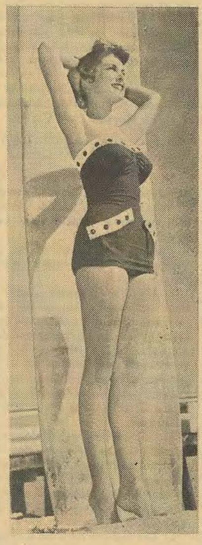
Janet Leigh, vedette M.G.M. que nous verrons dans « Scaramouche » revêt ici le tout dernier cri en matière de maillot.

Acte de foi d'une nature enthousiaste, cultivée, ouverte à tous les problèmes humains. Et comme nous lui demandons si ses fonctions de producteur signifient un adieu définitif à l'interprétation cinématographique: « Nullement, répond-il, mais la mise sur pied d'un film de fiction requiert un si long et patient travail préparatoire que ces temps d'arrêt sont autant d'obstacles dont je puis difficilement m'accommoder... »