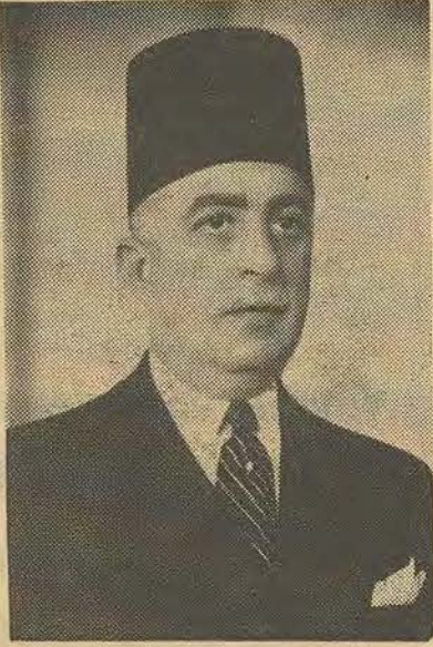
S.E. HUSSEIN SIRRY PACHA

la politique — celle-ci nous a causé tant de maux ! — et il est nécessaire, tout d'abord, d'assainir nos finances, d'assurer la valeur de notre monnaie et de reconstruire notre économie.