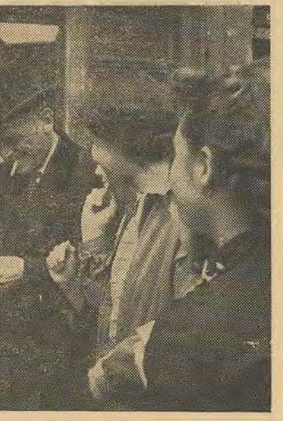
Douglas Fairbanks Jr. signant des autographes aux habitants de Bruxelles.