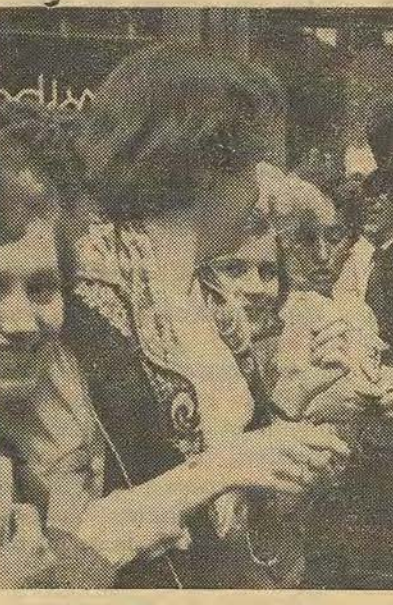
Douglas Fairbanks Jr. signant des autographes aux habitants de Bruxelles.

L'Histoire (ou la petite Histoire, si vous préférez) se répète: tout comme, il y a vingt ans, son père, feu Douglas Fairbanks Senior, partit chasser les images autour du globe (« Le Tour du Monde en 80 Jours »).