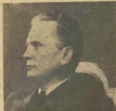
Le Maréchal TITO

...mais le maréchal Tito veille et, à la moindre menace d'agression occupera l'Albanie, détruisant le nid des pirates