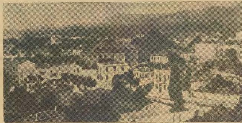
Valona, en Albanie, port en face duquel se trouve l'île de Saseno, où les Russes aménagent un Gibraltar à leur usage afin de commander le canal d'Otrante et de « boucler » à volonté la mer Adriatique.