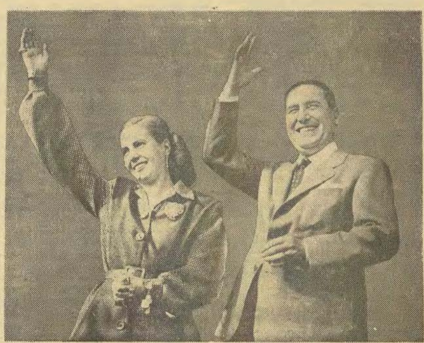
Le général et Mme Peron

Israël, sa création, son existence, le danger qu'il présente pour les pays arabes, — est une véritable vache à traire pour la propagande soviéto-communiste. Cette propagande a réussi là un coup de maître. Elle a escompté complètement les faits et, dans la masse arabe,