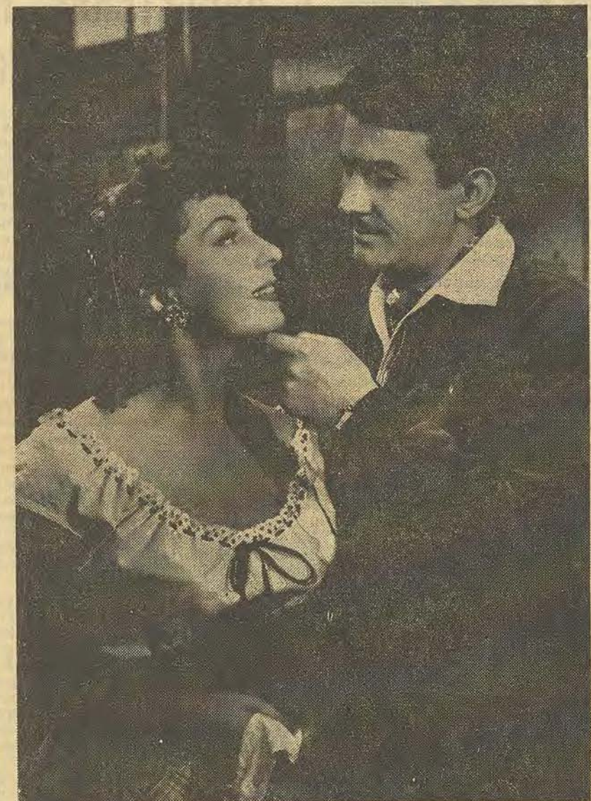
Viviane Romance et Frank Villard dans le sketch « Luxure ».

Elle était douce, elle était bonne, elle était belle, elle était généreuse et noble, et très chic. Et elle est partie d'une très douloureuse maladie en la supportant, comme la supportent les âmes fortes, et dont l'exemple du seul souvenir est un tonique.