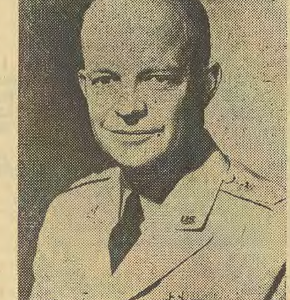
Le général Eisenhower

du futur commandant suprême. Que ce soit Ridgway, comme le désire le Pentagone, ou Gruenther, comme le souhaitent les Européens et «Ike» lui-même, son remplacement entrainera presque ipso facto une révision des rapports entre le S.H.A.P.E. et le «standing group» (groupe permanent) ainsi qu'une refonte des zones stratégiques de l'Europe occidentale.