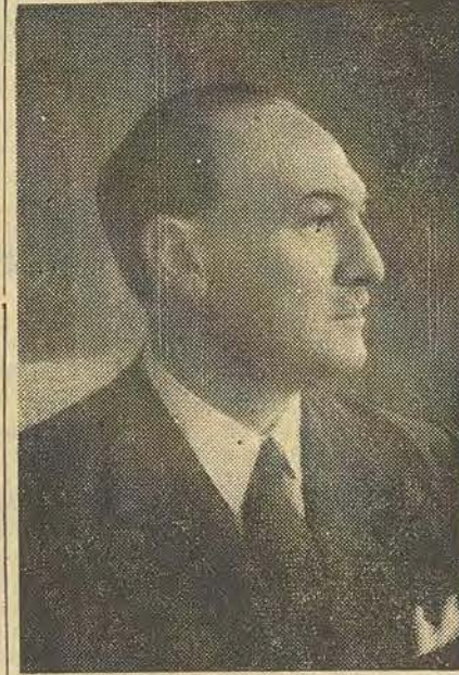
S.E. AZIZ ABAZA PACHA lauréat du Prix Fouad Ier de littérature pour l'année 1952.