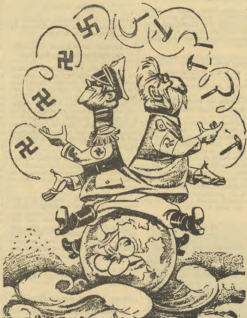
LES DEUX JONGLEURS