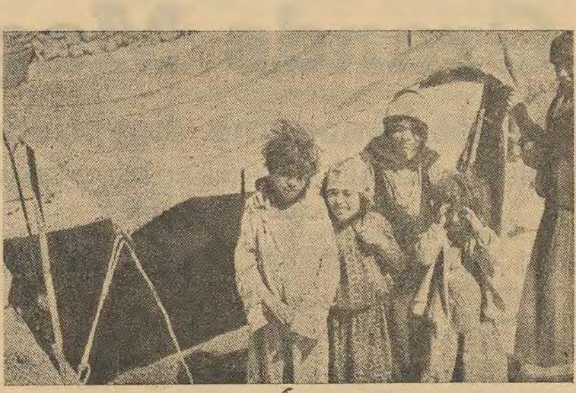
Un groupe de jeunes bédouins, souriant à l'objectif, devant leur tente.