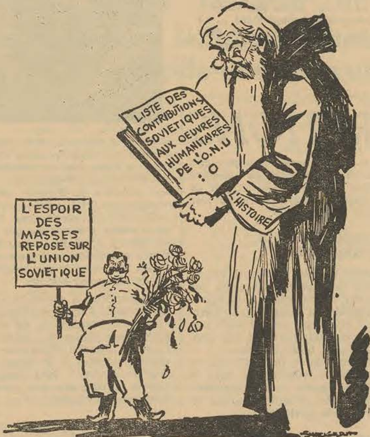
D'APRES LE QUOTIDIEN "THE SAN FRANCISCO CHRONICLE" SAN FRANCISCO, CALIFORNIE, U.S.A.