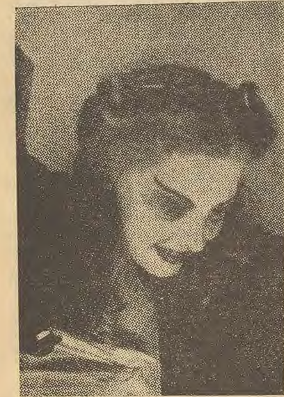
La première photo.

Avant l'agrandissement requis, le personnage demandé, sur cette épreuve. Avec le troisième plan se sera la même chose. Ces plans découpés seront soigneusement collés ensemble et retouchés pour donner l'illusion d'une même photo.