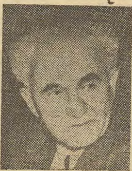
M. Ben Gourion

En principe, tous les partis sont représentés dans l'Histadruth, mais la direction est entre les mains du Mapai le parti ouvrier