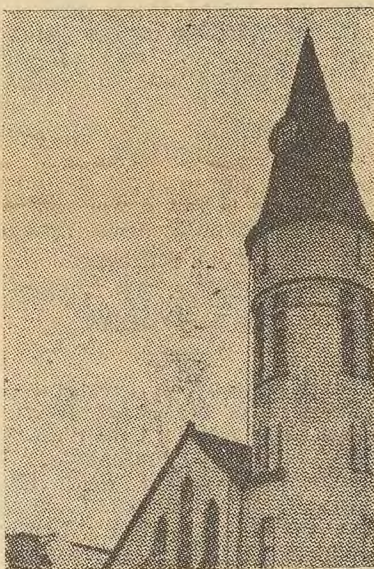
Le clocher d'église.

Les plus belles inventions sont réalisées à partir d'éléments simples: vous devez vous inscrire en lettres de plomb dans le cerveau, chercheurs amateurs.