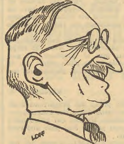
Le Président Truman