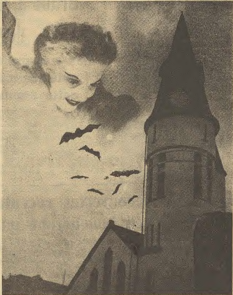
La photo définitive, c'est bien ce que nous avons essayé d'avoir: une femme vampire.

MATEURS de photographie, vous êtes nombreux de par le monde. Voulez-vous vous amuser un peu? Combien d'entre vous ont-ils réussi un photo-montage? C'est pourtant si simple et amusant. Une caméra, quelques négatifs et une chambre noire.