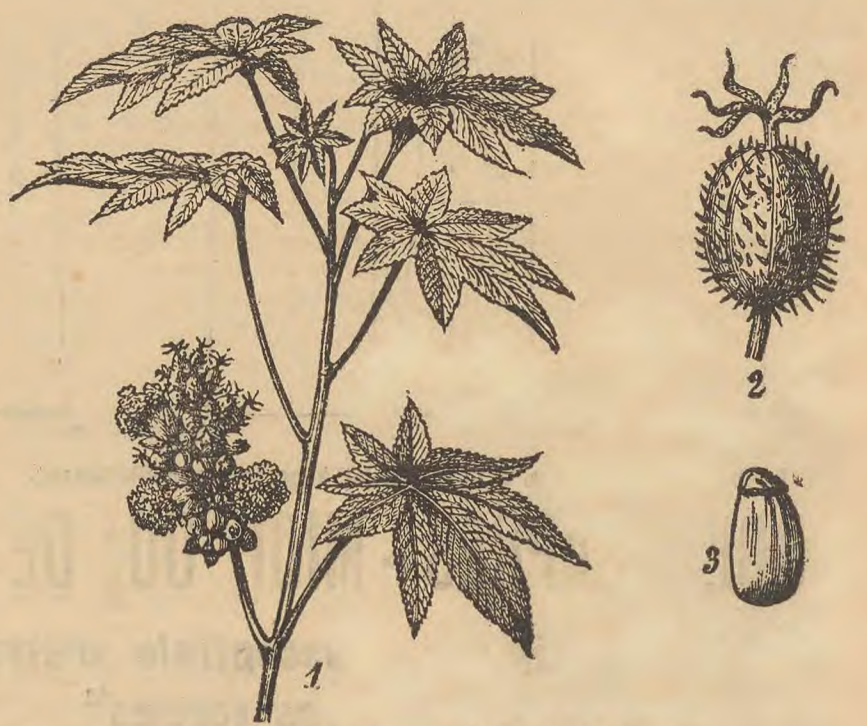
Le Ricin. 1) Un rameau. 2) Fruit. 3) Graine.