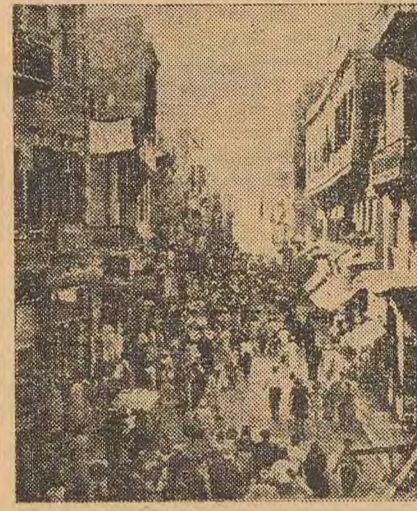
La rue du Moussy, un soir de fête.