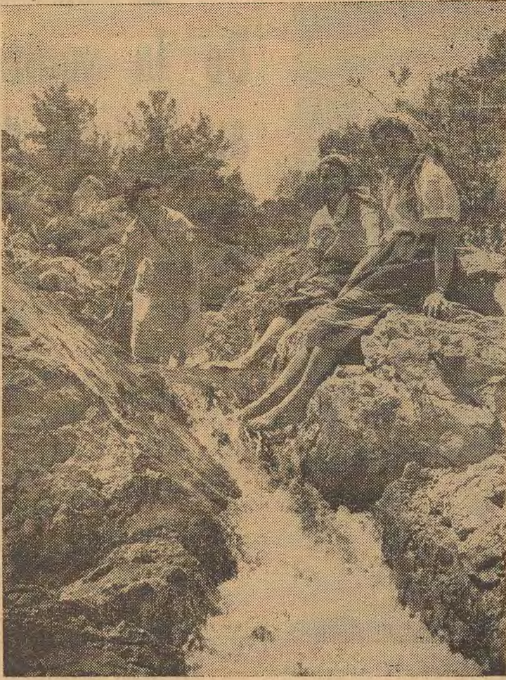
Trois beautés locales s'ébattent dans les eaux cristallines des «Sept Sources», un site enchanteur au sud de Rhodes

LES anciens Grecs plaçaient leur paradis dans des îles imaginaires... Rhodes est une îLE DES BIENHEUREUX.