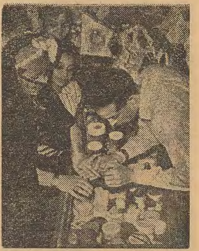
Une élégante égyptienne fait des emplettes.

clients assidus, cet humble hommage de ma reconnaissance. Le client se laisse tenter... il voudrait bien se payer quelque chose.