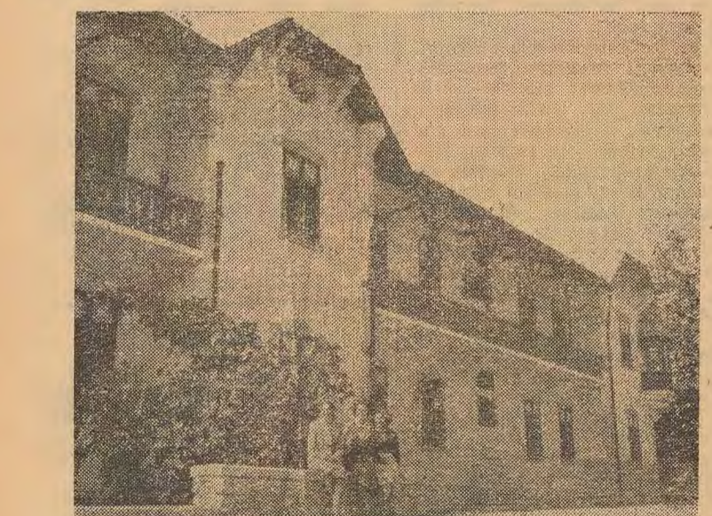
Penchés au sommet du Mont Elie et entourés de pins, deux hôtes juvéniles qui répondent aux jolis noms de Elaphos (Cerf) et Elephina (Biche). Les 4 grands hôtels de Rhodes accordent 30 o/o de réduction aux touristes payants en devises étrangères.