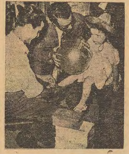
Une nouvelle paire de chaussures et un grand ballon.