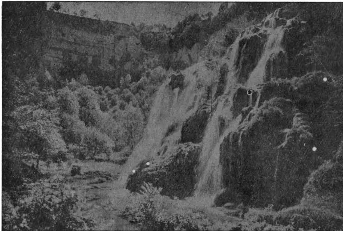
Vallée de Baume-les-Messieurs La cascade des Tufs