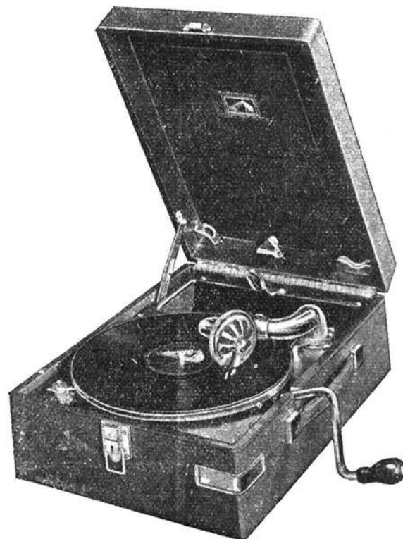
Modèle No. 102

Des couleurs attrayantes. Choisissez votre portatif en NOIR - BLEU - VERT - ROUGE.