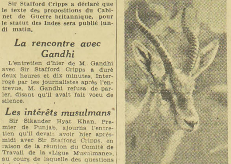
Lire en page 2 :