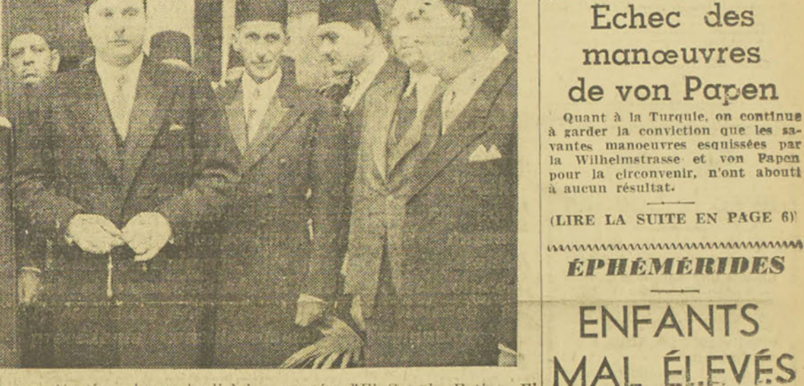
S.M. le Roi a fait hier ses dévotions du vendredi à la mosquée d'El Sayeda Fatima El Alfa au quartier de Bab el K'halk.

Voici une photo du Souverain prise à l'issue de la cérémonie. On reconnaît aux côtés de Sa Majesté S.E. Mostapha el Nahas pacha, président du Conseil, S.E. Ahmed Hassanein pacha, chef du Cabinet Royal, des dignitaires de la Cour et d'autres personnalités.