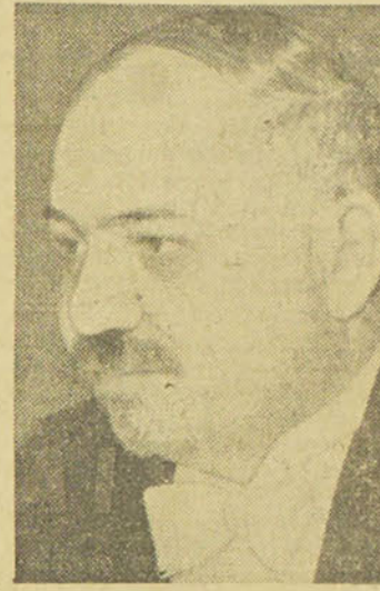
M. Ivan MAISKY

«Pris ensemble, les Alliés possèdent déjà les instruments essentiels de la victoire: troupes, tanks, avions et armes. Il ne faut pas perdre son temps à attendre que soit cousu le dernier bouton à l'uniforme du dernier soldat. Il faut parfois combattre dans des conditions qui ne sont pas celles que l'on désire, mais qui n'en sont