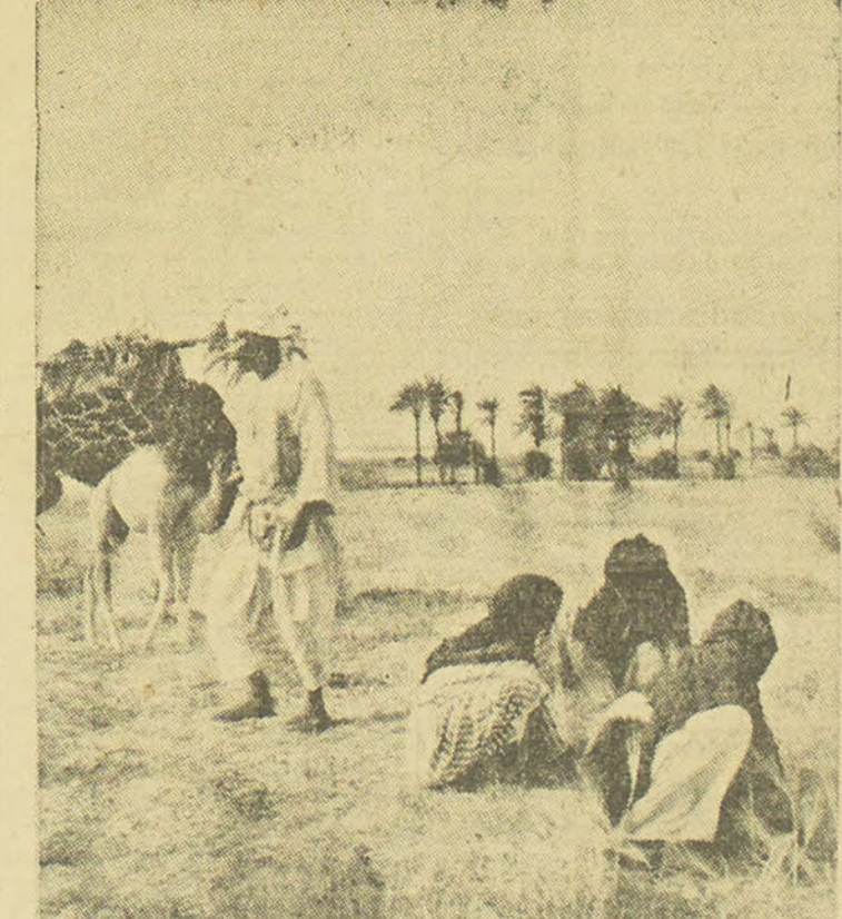
Grâce à des réformes éclairées, une génération plus saine de fellahs méme, dans la Vallée du Nil une vie nouvelle et plus heureuse que par le passé.