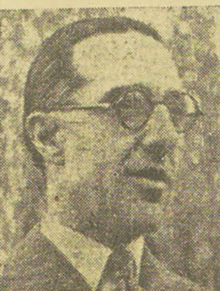
...qui, en attendant l'arrivée de M. R. Casey assure les fonctions de ministre d'Etat au Moyen-Orient.