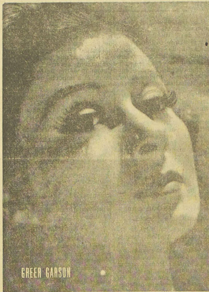
...que nous verrons dans 'Blossom in the Dust'.