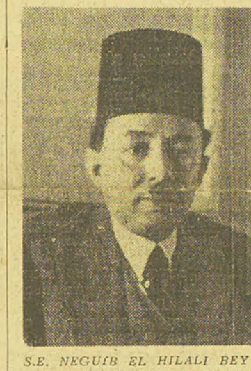
S.E. NEGUIB EL HILALI BEY ministre de l'Instruction Publique

Voici le communiqué publié aujourd'hui à Canberra par le Premier ministre, M. Curtin: «Des avions alliés ont exécuté le 20 mars une opération couronnée de succès contre des navires de guerre ennemis à Rabaul. On rapporte qu'un croiseur lourd japonais fut incendié et coulé. L'attaque fut exécutée pendant la nuit, face au tir intense des batteries anti-aériennes installées au sol et sur les bateaux se trouvant dans le port. «Opérant à haute altitude, les appareils alliés ont concentré leur attaque contre le croiseur lourd. Les premières bombes, lâchées à 9000 mètres, tombèrent près de l'avant et de l'arrière du croiseur. «Des chasseurs ennemis engagés à ce moment le combat avec les bombardiers alliés. Deux attaques furent repoussées et un chasseur ennemi du type «Ze» fut aperçu plongeant à l'eau ouvert. Malgré ces attaques, d'autres bom-