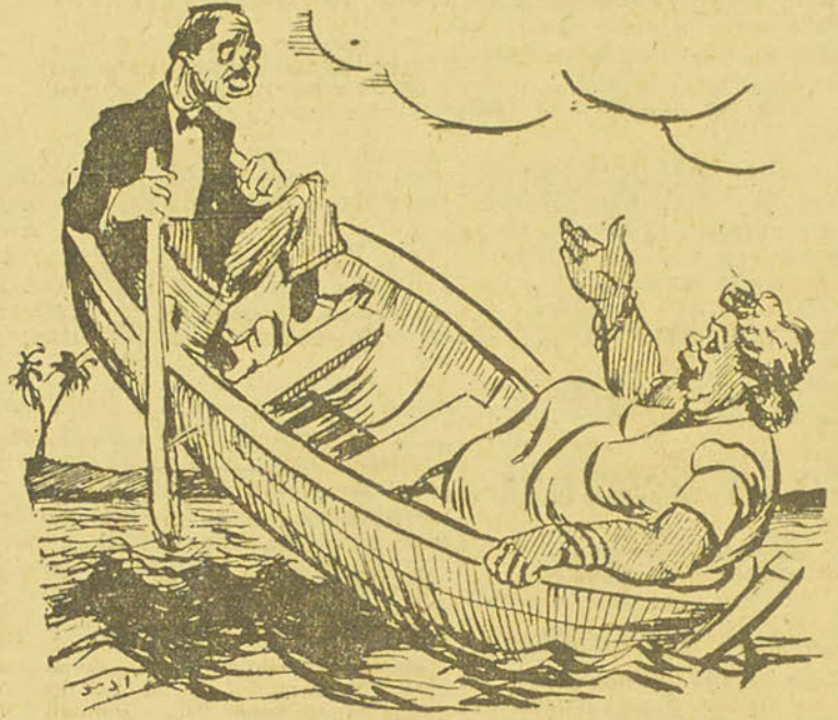
FORCE MAJEURE Madame. — Et tu disais que tu savais ramer... (Kalam El Nass).

Nous avons déjà eu l'occasion de parler des mesures prises par les autres gouvernements pour assurer à leurs peuples les meilleures conditions d'existence, afin de les prévenir contre les mala-