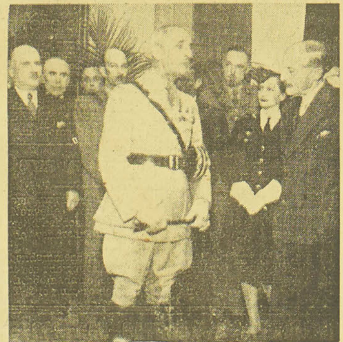
Nous avons annoncé hier que le général Catroux avait assisté à une réception offerte en son honneur par les anciens combattants français d'Alexandrie.