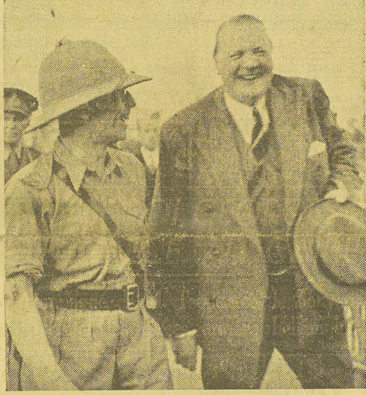
S.M. le Roi des Hellènes accueilli à sa descente d'avion par S.E. l'ambassadeur de Grande-Bretagne.

Accompagné de M. Tsoudéros, le Souverain va visiter les forces armées helléniques