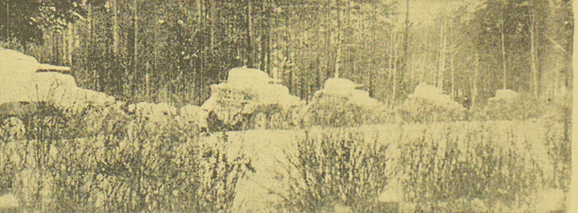
Une vue à quatorze jours des opérations en route vers le front.