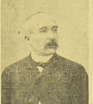
CLÉMENTINEAU, en 1895

Il avait prononcé à Salernes un des plus beaux discours de sa carrière; il avait jeté à ces hommes, à ces électeurs, lui, l'orgueilleux, toutes les misères et toutes les grandeurs de sa condition. Une confession! et combien elle a dû coûter à cet aristocrate! Toute sa vie, depuis Mazas, Montmartre et Clément Thomas jusqu'à Norton, «on m'a accusé de la mort des généraux! On m'a accusé d'avoir touché les chèques de Panama et l'argent de Herz! On m'a accusé d'être vendu à l'Angleterre! Et je suis chargé de dettes. Et mon journal devra cesser de paraître faute de fonds! Et je paie par petites mensualités les meubles de mon modeste logement! Les foules n'aiment pas qu'on leur fasse des confidences sur ce mode là, elles n'aiment pas qu'on «humille» devant elles; elles n'aiment peut-être pas non plus la sincérité! Il faut être fort devant elles. Et puis cette vieille sagesse des nations « Il n'y a pas de fumée sans feu! », Dragulignan conspu Clémentineau, rejeta Clémentineau.