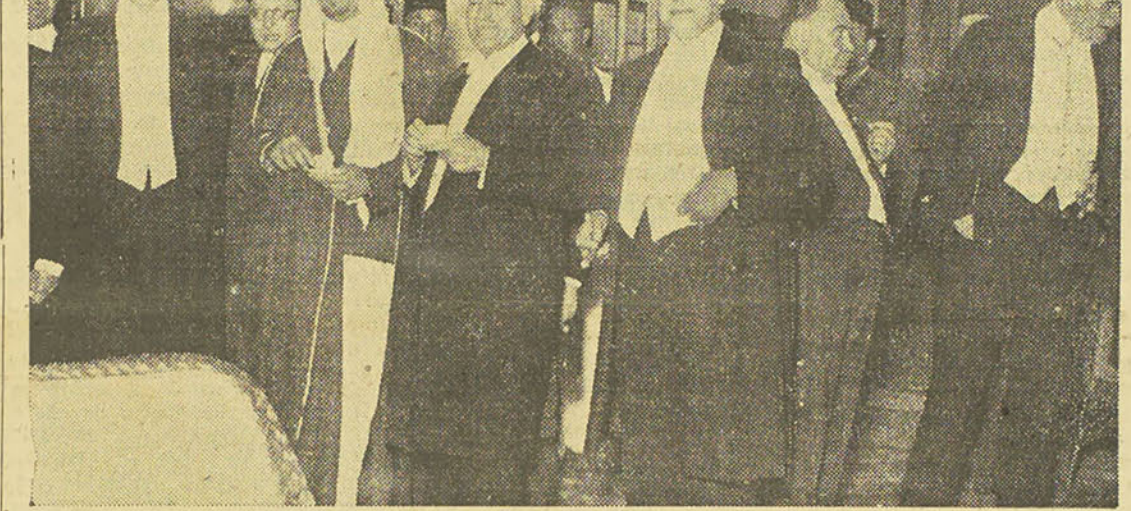
Voici, d'autre part, une photo prise hier soir au Mena House après le banquet offert par Nahaas pacha. On reconnaît entourant l'Emir le Président du Conseil, le ministre des Finances, les ambassadeurs de Grande-Bretagne et de l'Iraq et d'autres personnalités.

Dans l'après-midi, l'Emir quitta la R.A.F. pour passer la nuit en compagnie d'une unité spéciale des forces de terre. Après le dîner au mess des officiers, il dormit dans une tente.