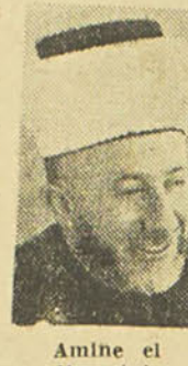
Amine el Hussein

Particulièrement sévère, le jugement que vient de porter l'Emir Abdallah de Transjordanie sur le rôle funeste de Hadj Amine el Hussein, ancien Moutfi de Jérusalem, a causé une profonde sensation dans tout le monde islamique.