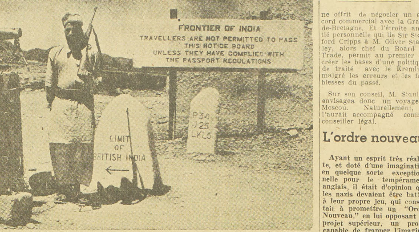
Aux Indes, les qualités réalistes de Sir Stafford Cripps seront mises à une épreuve décisive. Si sa mission est couronnée de succès, il passera dans l'histoire comme l'un des plus grands réalisateurs de la politique britannique.

C'ÉTAIT la dernière traversée du paquebot de luxe italien « Rex » qui avait quitté le port de New-York le 13 avril de ce fatal printemps de l'année 1940. A bord se trouvait Sir Stafford Cripps, rentrant d'une randonnée qui l'avait conduit jusqu'aux Indes, chez Gandhi et son vieil ami Nehru, en Russie chez Staline, en Chine chez le généralissime Tchang Kai Chek, au Japon chez le prince Konoé, et, finalement, aux États-Unis chez le président Roosevelt.