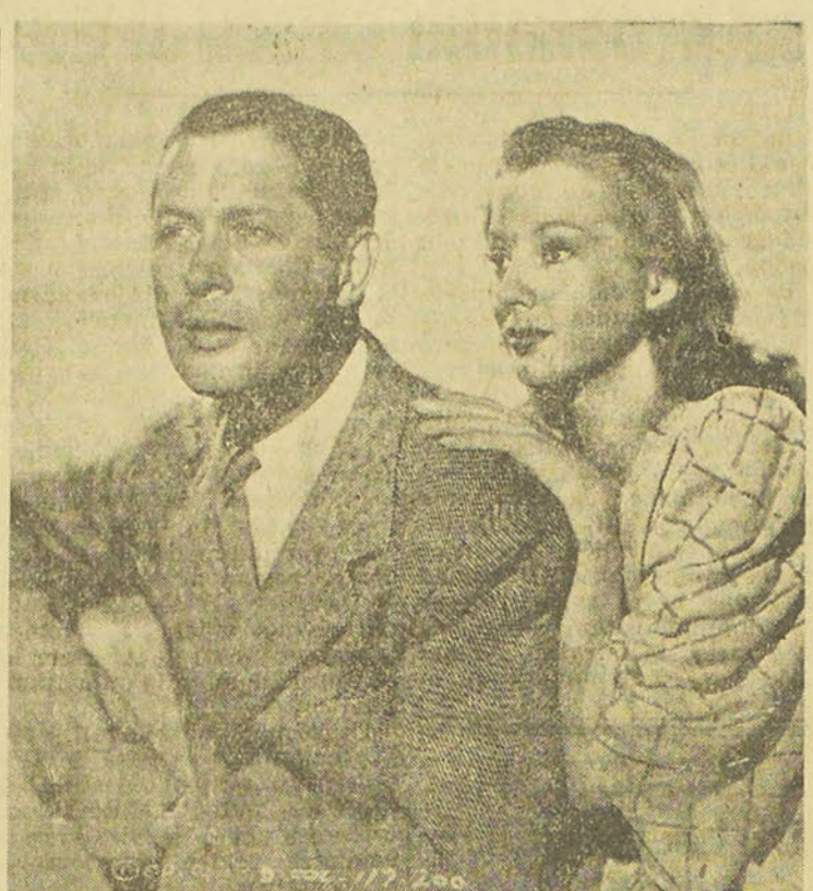
Robert Montgomery et Evelyn Keyes les vedettes de « Here Comes Mr. Jordan ».

Mais Eric n'est pas mort, et il annonce son arrivée aux Etats-Unis. Léni la mort dans l'âme se sépare de celui qu'elle aime maintenant pour consacrer sa vie à son pseudo sauveur.