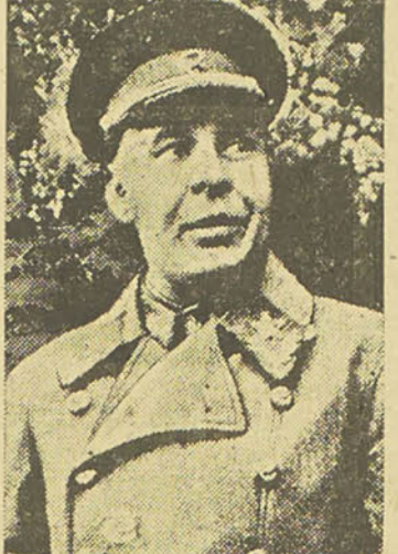
LE MARCHEL TIMOCHENKO

Le communiqué de guerre publié aujourd'hui par le Grand Quartier Général du Moyen-Orient déclare: Nos patrouilles de combat ont de nouveau été actives au cours de la journée et il en est résulté une série d'engagements avec l'ennemi. Malgré la force des patrouilles ennemies — qui comprennent de l'artillerie et, au moins dans un cas, des tanks — elles furent chaque fois obligées de se retirer, laissant des prisonniers entre nos mains et subissant la perte de quelques transports motorisés par l'action de nos obus. Nos forces aériennes ont appuyé effectivement ces opérations.