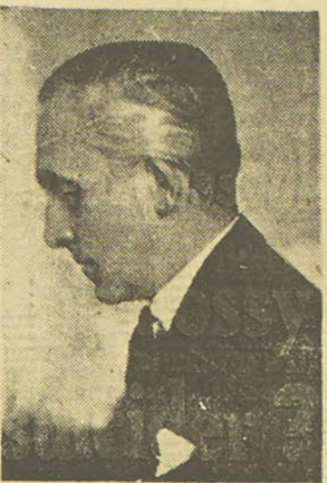
Le comte BARDOSSY

M. Bardossy fut également informé que les négociations engagées à Bucarest mettaient en cause les gains territoriaux réalisés par la Hongrie. En d'autres termes, en récompense de sa loyale attitude particulièrement ce qui concerne l'envoi de troupes contre les Soviets, la Roumanie serait sur le point de se voir accorder une rectification de l'accord de Vienne qui avait rétrocédé la Transylvanie à la Hongrie. Peu après la réception de ces nouvelles à Budapest, Bardossy annonça que le Cabinet hongrois ferait l'objet d'un remaniement, avec l'élimination provisoire de M. Bardossy dont on a déclaré qu'il était « transporté à l'hôpital dans un état de santé précaire. »