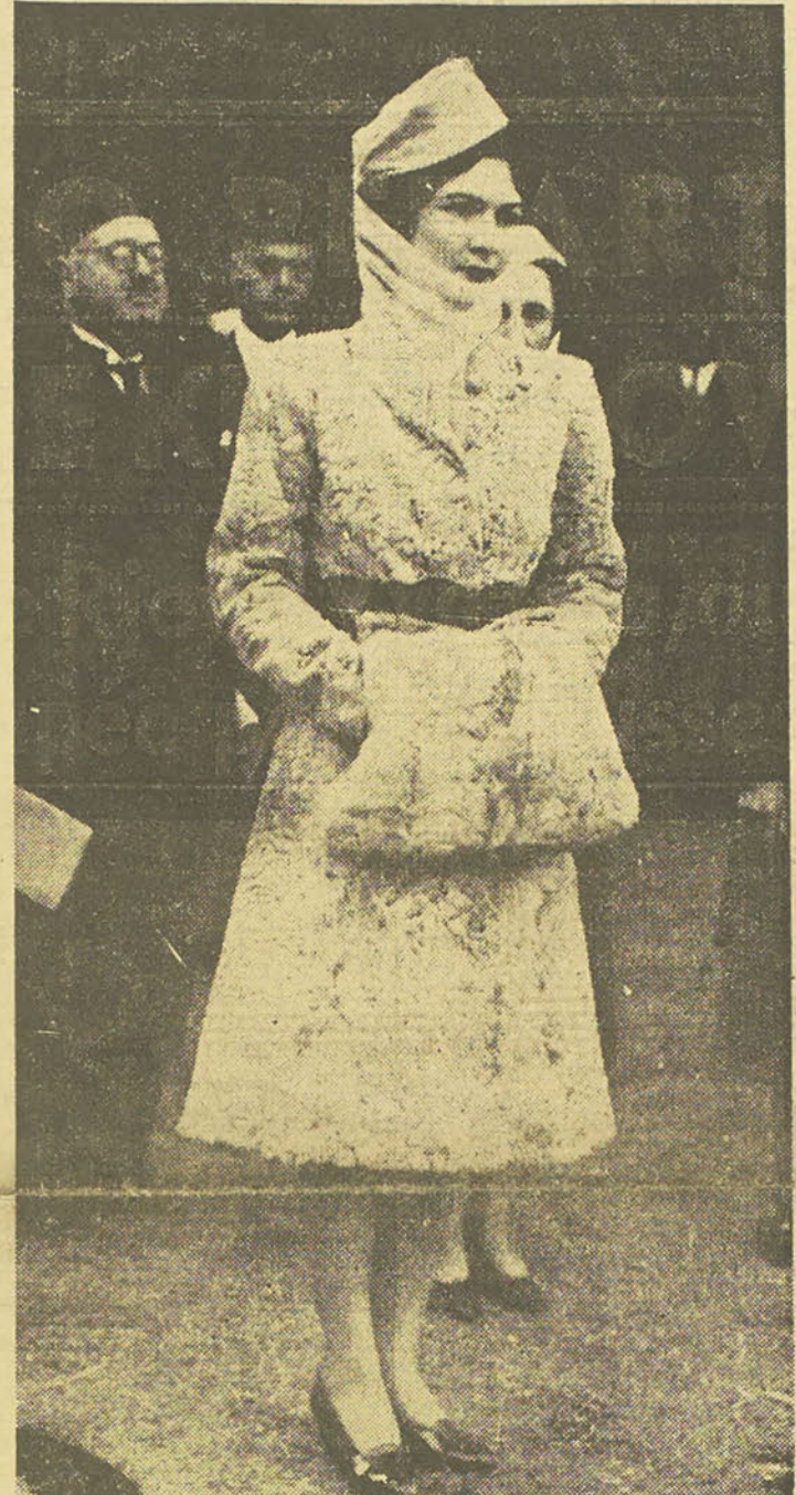
S.M. la Reine à l'Exposition des fleurs S.M. la Reine a daigné inaugurer samedi, l'Exposition des fleurs, fruits et légumes au Jardin d'Omran. Voici une photo de Sa Majesté prise au cours de la visite.

Londres, le 9. (B.O.P.) — La R.A.F. a, de nouveau, dans l'après-midi de dimanche, exécuté une attaque contre une usine de la région parisienne travaillant pour les Allemands. Un communiqué du ministère de l'Air annonce : « Cet après-midi, nos bombardiers ont attaqué les Usines Matford à Poissy, près de Paris, qui produisent du matériel de guerre pour l'Allemagne. L'usine et le parc à camions ont été touchés par les bombes. » « D'autres bombardiers, fortement escortés ont attaqué la centrale électrique de Comines, près de Lille, ainsi que les voies ferrées à Abbeville. Les chasseurs de l'escorte ont abattu deux chasseurs ennemis. Un de nos bombardiers et trois chasseurs sont manquants. On ajoute que les bombardiers britanniques étaient peu nombreux. » L'usine Matford à Poissy est située à 16 kilomètres au nord-ouest de Paris. C'était tout d'abord une usine destinée à la fabrication de moteurs d'avions, mais elle fabrique maintenant des camions pour l'armée allemande au rythme croissant de 20 par jour. Les bombes ont été jetées à basse altitude et des coups directs ont été enregistrés. Le ciel était clair et le soleil brillait encore. Des flammes et des nuages de poussière s'élevèrent