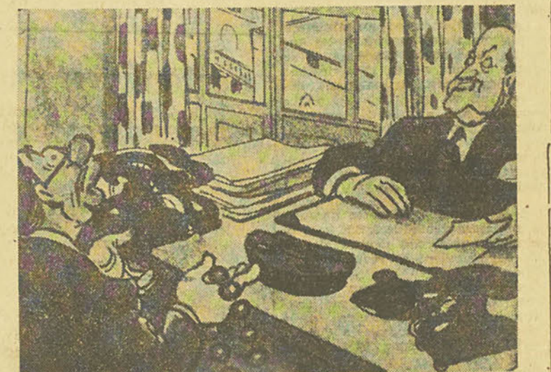
Aucun Parlement n'a duré la pleine période constitutionnelle. Mardi effondré: En vertu de la Constitution, la durée du Parlement s'étend sur cinq années. A quoi devons-nous croire, à la Constitution ou aux événements?

Dans la revue «Al-Isnein», M. Moustapha Amin trace un saisissant tableau de l'état des élections pendant la campagne électorale. Pour la première fois depuis les élections de 1938, les pauvres électeurs sentent qu'ils sont «la source du pouvoir». Comment se fait-il que ce riche seigneur daigne descendre de son automobile pour servir la main à un pauvre électeur, alors que dans le temps l'automobile filait à toute vitesse, projetant parfois dans le canal, le fellah et sa monture en soulevant, aux yeux des passants, des nuages de poussière? Que Dieu bénisse les élections qui ont réduit la mor-