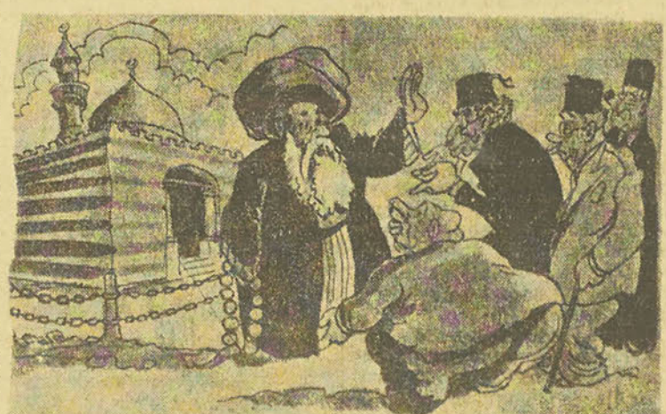
L'INTERCESSION DU MARABOUT

«L'Ahrâm» écrit: Des consommateurs nous écrivent pour se plaindre du fait que les marchands de tissus exploitent les circonstances actuelles et vendent aux pauvres des tissus à des prix très élevés. Ces consommateurs demandent que les autorités prennent les mesures nécessaires pour empêcher de pareilles exploitations.