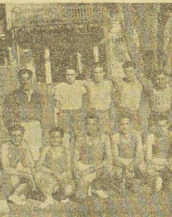
Avant la finale du premier tour: Collège Français et Lycée Français posent pour «La Bourse Égyptienne»...

Le compte rendu de la dernière réunion de l'U.S.E.P.E