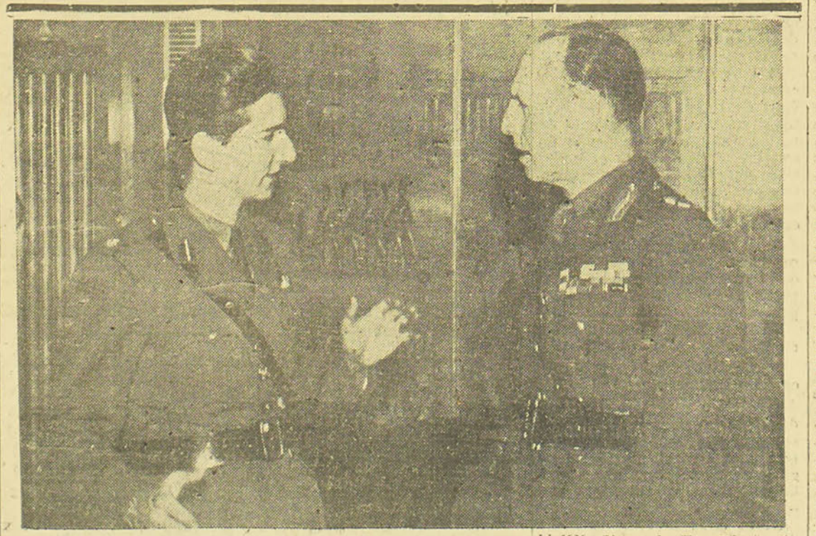
DEUX SOUVERAINS AMIS LL.M.M. Pierre de Yougoslavie et Georges de Grèce après la signature du pacte grec-yougoslave.

Londres, 27. — (REUTER). — M. J. L. Garvin a démissionné de son poste de rédacteur en chef de l'«Observer».