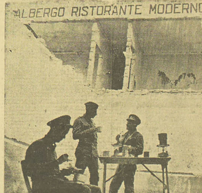
La garnison de Tobrouk jouit actuellement d'un calme relatif et les hommes ne manquent pas d'en profiter, comme on le voit.