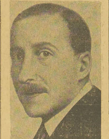
Rio de Janeiro, 24 (A.F.I.) — Stefan Zweig, le célèbre écrivain autrichien de naissance, ainsi que sa femme ont été trouvés morts dans leur villa à Petropolis, près de Rio, hier, dans des circonstances laissant supposer un suicide par asphyxie au gaz.

STEFAN ZWEIG S'EST SUICIDÉ ...avec sa femme