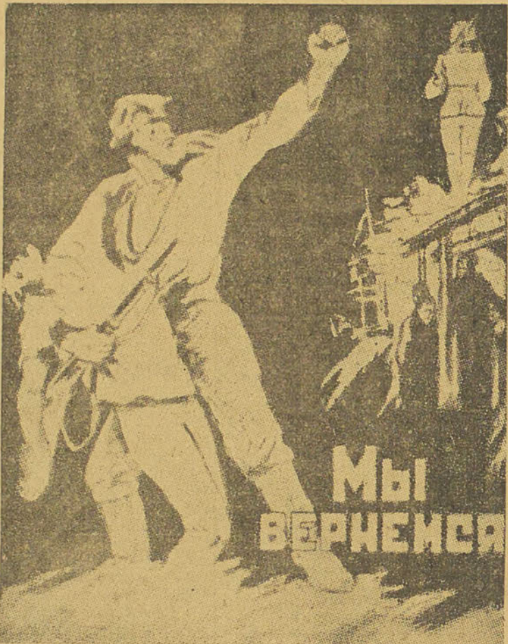
« Nous reprendrons ! », dit cette officine que les troupes russes opposent dans les villes qui étaient obligées d'évacuer... et elles ont tenu parole !

Londres, 14 (B.O.P.). — Un indice de la situation sur le front russe est fourni par un ordre du jour allemand aux troupes stationnées dans un secteur à l'ouest du front. Cet ordre du jour dit: « Il n'est pas possible de créer une ligne de défense continue et il est donc nécessaire de construire des points de défense puissamment fortifiés, et de défendre la ligne du front en s'établissant solidement sur ces points. »