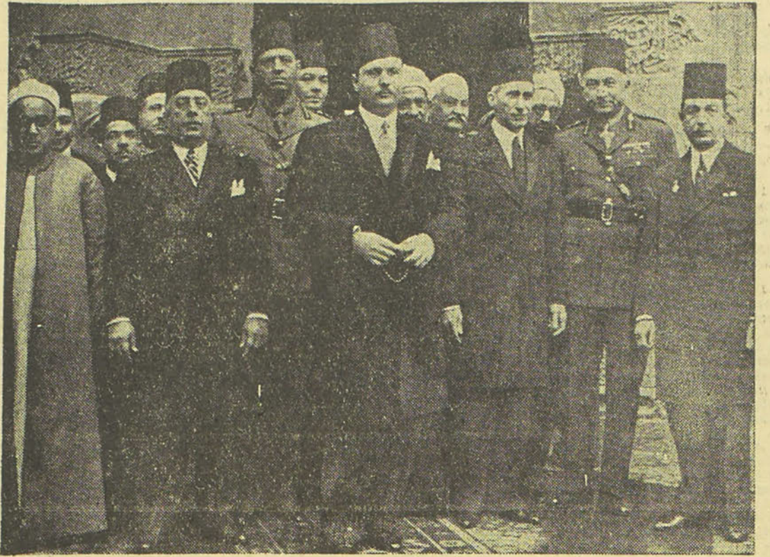
S.M. le Roi a fait hier ses adieux au vendredi à la mosquée de Sayeda Zeinab où, après les prières le Souverain inaugura la nouvelle aile élevée à la mosquée. On voit sur notre photo, prise à l'issue de la cérémonie, S.M. le Roi entouré du Président du Conseil de Recueil de l'Achar, du chef du Cabinet Royal, du Premier Chambellan, des autres dignitaires de la Cour et de nombreuses personnalités.