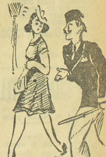
LE COURT-CIRCUIT D'abord le ne m'appelle pas Fatma, espèce de maitru et puis je ne vous connais pas. - Fatma, Zelnab, ne importe. Du reste dans le black-out... (AL CHO'OLA).

G.B.H.S.C.A. Cup (2ème catégorie) 11.1.42: Sucreries d'Egypte v. Sudan Import, à A.S.C. 11.1.42: Matossian v. Sté.