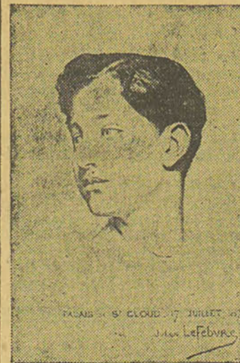
LE PRINCE IMPÉRIAL emplois du temps inexorables. Les professeurs se succèdent auprès de lui. Et, outre que les matières qu'il apprend ne sont pas toujours amusantes, eux-mêmes sont quelquefois déplaçants ou sévères ou ennuyeux. Le prince est condamné à les écouter respectueuse-

Il n'y a rien d'aussi austère que l'éducation d'un prince. A l'âge où toutes les joies de l'enfant sont dans la camaraderie, les jeux, les batailles et parfois l'étude en commun, le Dauphin est seul. Ses journées sont réglées, ses