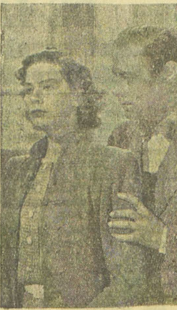
Wendy Hiller et Rex Harrison, dans «Major Barbara»...